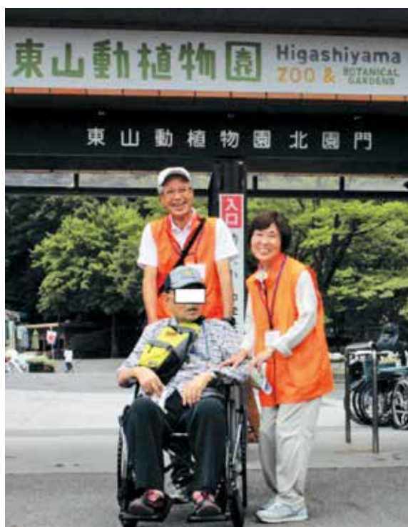
東山動物園で車椅子介助

初めは、顔が写らないように注意を払っていたのですが、車椅子に乗っている方から、「顔なんか写っても構わん」と言われ左の写真を撮りました。そうしたら、この方が手荷物からカメラを取り出し、「わしのカメラで写して」と言われ、撮ってあげたら大変喜んでいただき、ボランティア活動冥利に尽きる経験をさせていただきました。