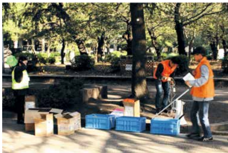
鶴舞公園で早朝から準備

私は、昭和鯉城会で広報委員会に所属しているので、当日のボランティアの活躍を撮影に行くと施設の方から「顔がわかるような写真は止めてほしい」との要望がありました。