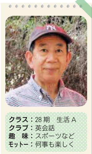
クラス：28期 生活A クラブ：英会話 趣味：スポーツなど モットー：何事も楽しく

一ヶ月位前の話ですが、突然「電気には色が付いていますか？」と聞かれたので「うーん？」と一瞬考えてから「電気には色は付いていないよ、雷が光るのは電気の色ではなく電気が流れたからその周りの空気が明るく光っただけだよ」と答えましたが。テレビ画面は光っていても裏側はいつも真っ黒クロスで何も光っていない。もし色が付いてピカピカ光れば皆さんももっと楽しく思うでしょう。でもこれが電気の原点です。今日の地下鉄で途中から乗ってきた老人に席を譲っている光景を見ながら、あぁこれが普通なのだと感じていました。譲る人も譲られる人もめずらしいことにしてはいけないと思う。これも地下鉄を使う人の原点です。世の中いろいろと考えて行かなければならない問題も多々ありますが、相手を思いやる気持ちだけはいつも原点に戻って誰も持っていたい。私も思いもかけず中鯉城会の会長を2年続けることになりましたが、これも原点に戻って相手を思いやる気持ちの一つと考えて行かなければと。皆さん、これからももっともっと楽しんで行きましょうね。