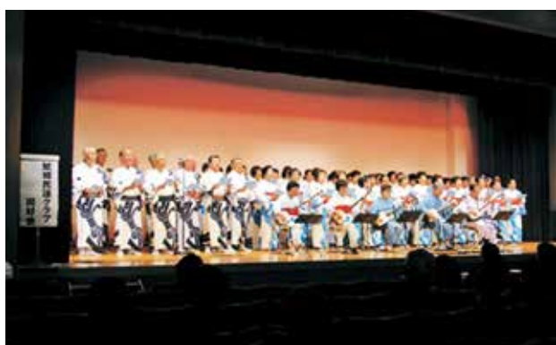
鯉城民謡クラブ同好会