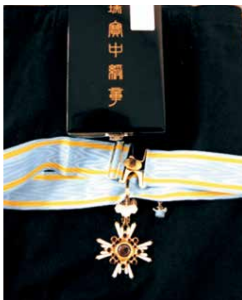
瑞宝中綬章の勲章