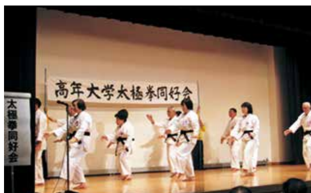
高年大学太極拳同好会