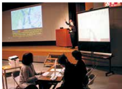
手話通訳・要約筆記