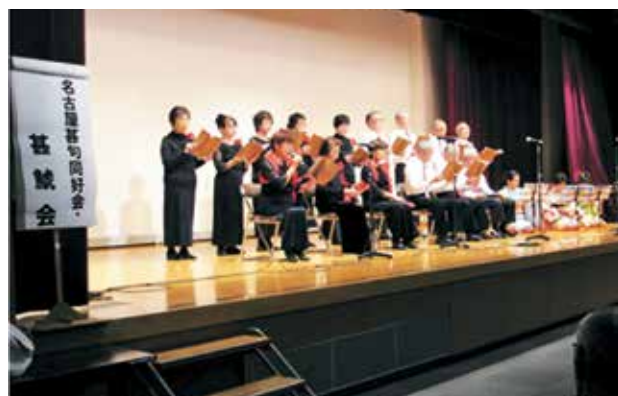
名古屋甚句同好会・甚鯉会