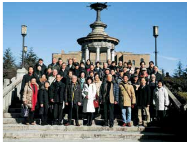
(4 月に花をつけた鶴舞公園のヤブツバキと見守る会に参加された鯨城会の皆さん)