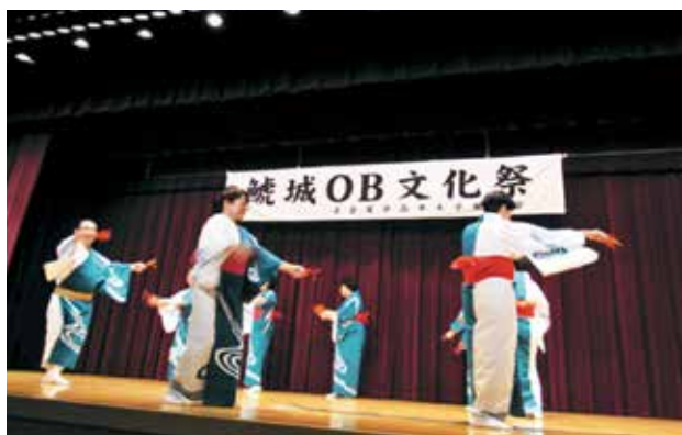
民謡同好会 ふなっこ