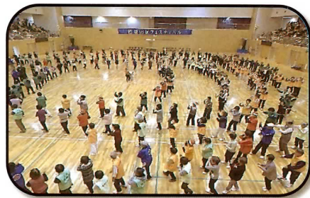
大勢の会員が「炭坑節」を踊り、大変な盛況でした。(平成29年 第1回開催時)

今回は、16区のフェスティバル委員とサポーターが、自分たちで企画・運営するという鯨城会始まって以来初めてのビッグイベントです！！