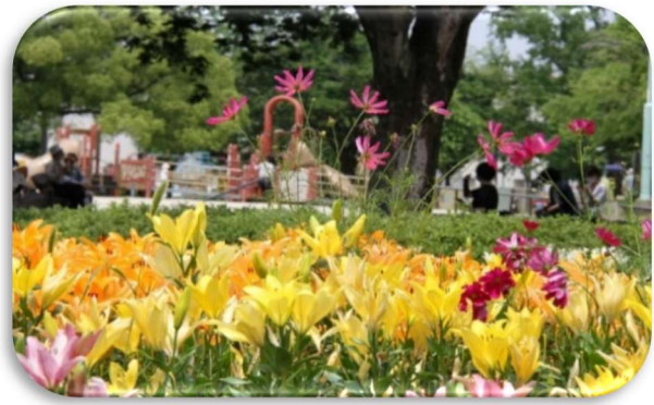
ゆり (千種公園) 6/上 近場のお手頃なゆり園です