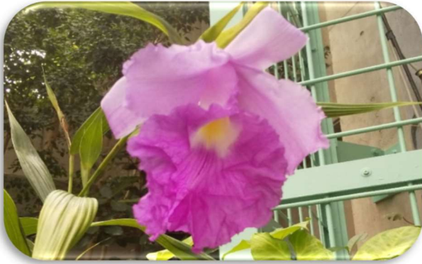
ソブラリア (フラリエ) 5/25 ササの様な株姿の洋ラン (カトレアに似た)