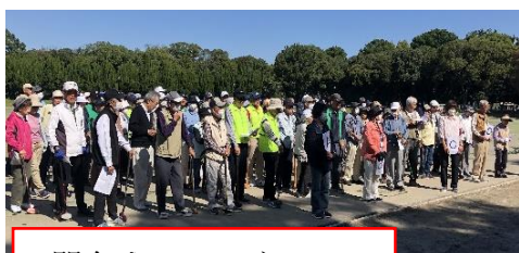
開会式 A～D ブロック

第22回グラウンド・ゴルフ交歓会が令和5年10月18日(水)に庄内緑地陸上競技場で秋晴れの中開催しました。参加者はプレーヤー160名とスタッフ合わせて180名でした。成績は、A～Dゾーン毎に計20名を表彰しました。これらの方々の平均年齢は81歳、最高齢は91歳と驚きでした。日頃の同好会での活動成果が十二分に発揮されたと思われます。グラウンド・ゴルフの各区の競技者人口の差異があることより、個人戦の戦いとなりましたが、各区混合の32グループに編成され、グラウンド・ゴルフ大好きプレーヤー同士の会話も弾み、楽しい交歓会ができたと思われます。