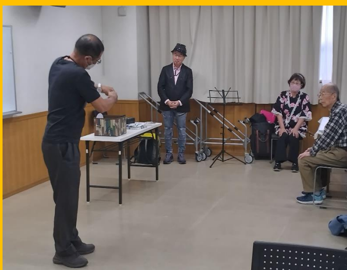
ゲー・チョコキ・パー伊勢代表によるボール遊び