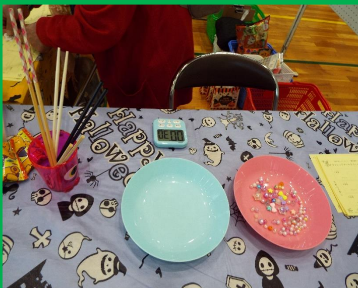
ビー玉をお箸で挟みお皿に30秒間で移すゲーム