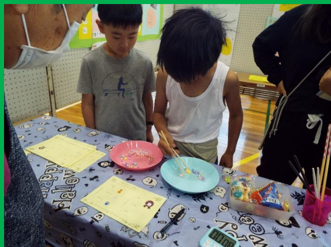
ビー玉をお箸で30秒間でお皿に何個移せるか?