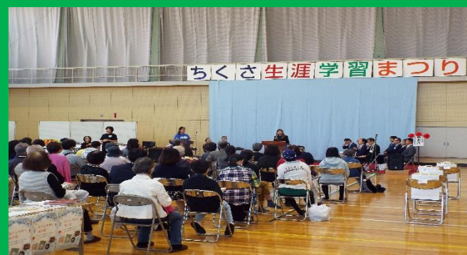
ちくさ生涯学習まつりの開会式風景