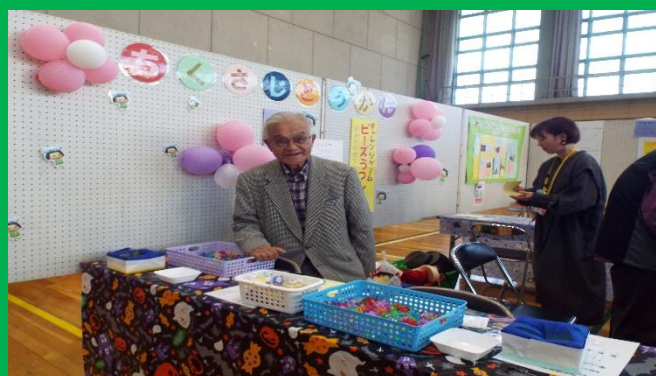
ボランティア活動間の筆者