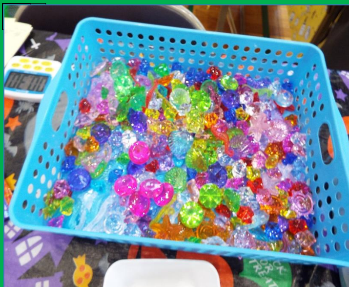
宝さがしのラス玉 同じ色・形のものを選ぶ