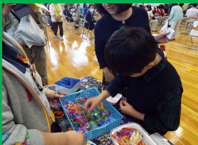
宝さがしで同じ色・形のものを30秒間で探すゲーム