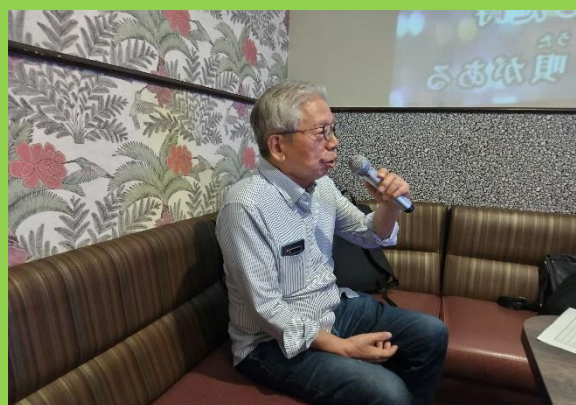
山口氏「生きてりゃいいさ」(加藤登紀子)を唄う