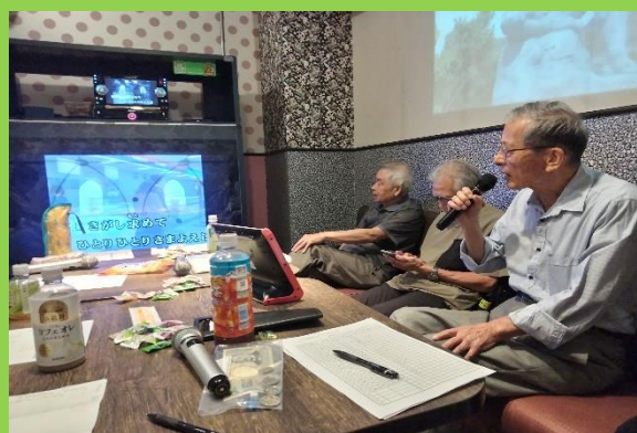
増田氏「孫」(大泉逸郎)を唄う