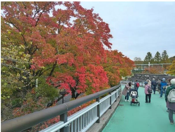
動物園から植物園に通じる場所での見事な紅葉を愛でる。