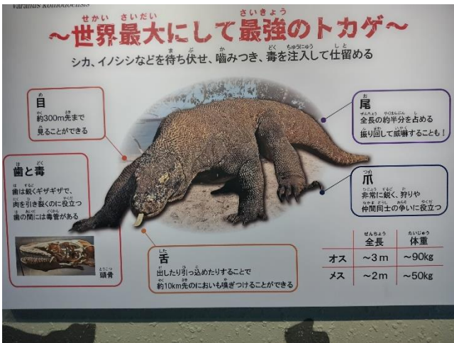
肉食の「コモドオオトカゲ」の説明案内板