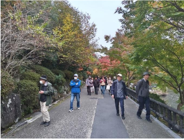
例年だと既に紅葉が見られる場所なのに残念！！