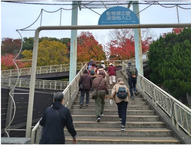
動物園内では、既に紅葉が見所となっていた。