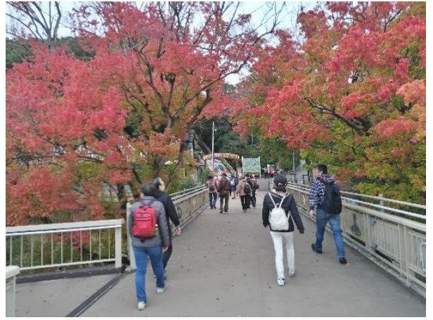
先ず初めに「コモドオオカゲ」を見るために急ぎ歩く。