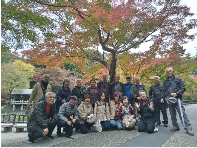
散策の途中にて、メーテレの報道陣より声がかかりスマホにて写真を撮っていただく。