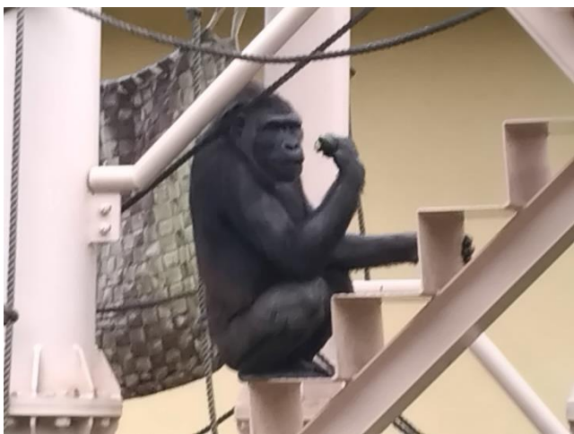
相変わらず人気の「イケメンゴリラ・シャバーニ」