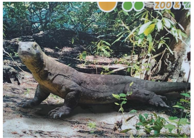
舎の外に設置の「コモドオオトカゲ」の案内板