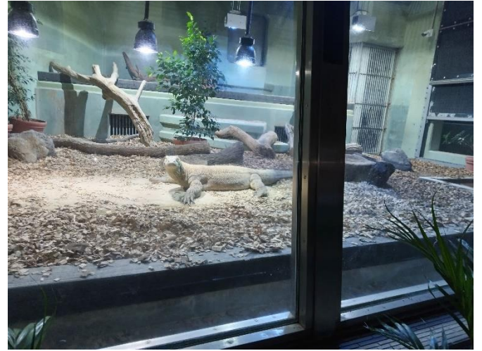
国内唯一の展示となって人気抜群の「コモドオオトカゲ」