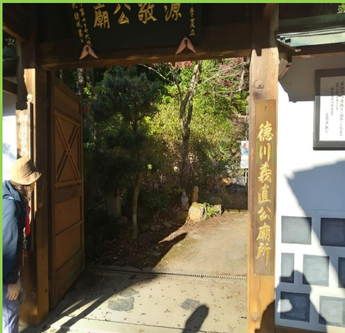
徳川義直公廟所の入り口。現在工事中で内には入れなくなっている。覗いてみる。