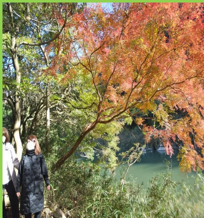
「4号トンネル」付近での一部紅葉した処が見受けられた。