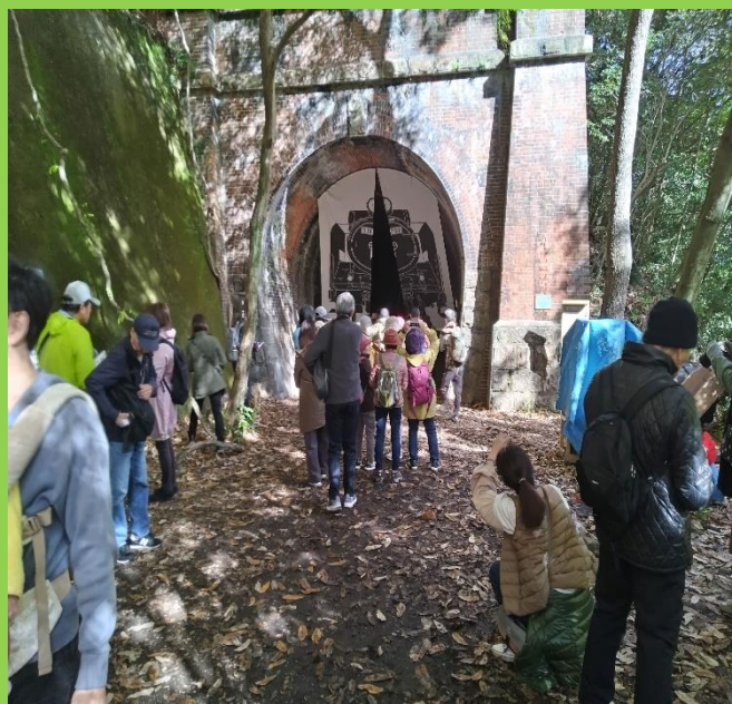
「3号トンネル」の西側出入口