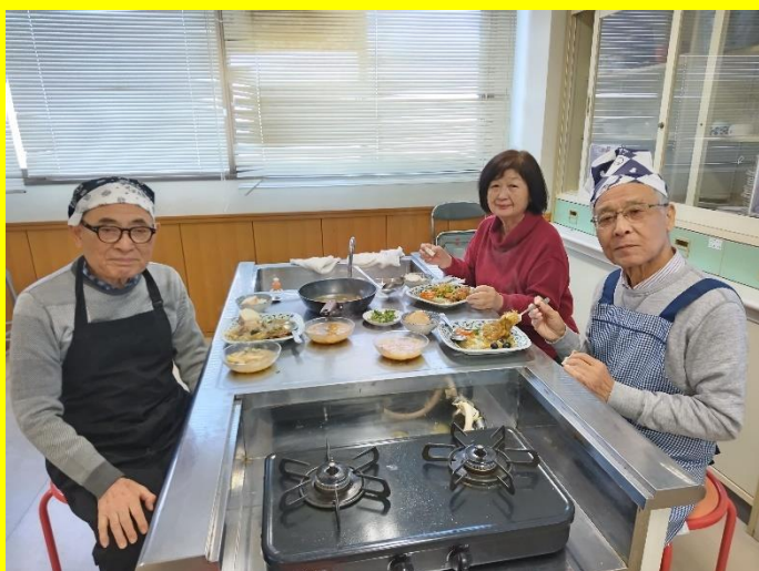
久連石氏(24期)、横地さん(33期)、片山氏(27期)