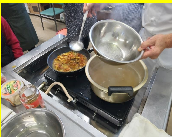
鶏肉の炒めに既に作られたスープを多めに入れる