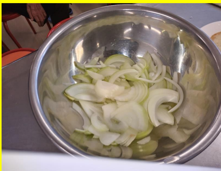
スライスした玉葱、これから炒める準備