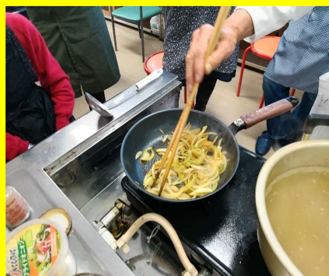
スライスした玉葱を油少々ひき炒める