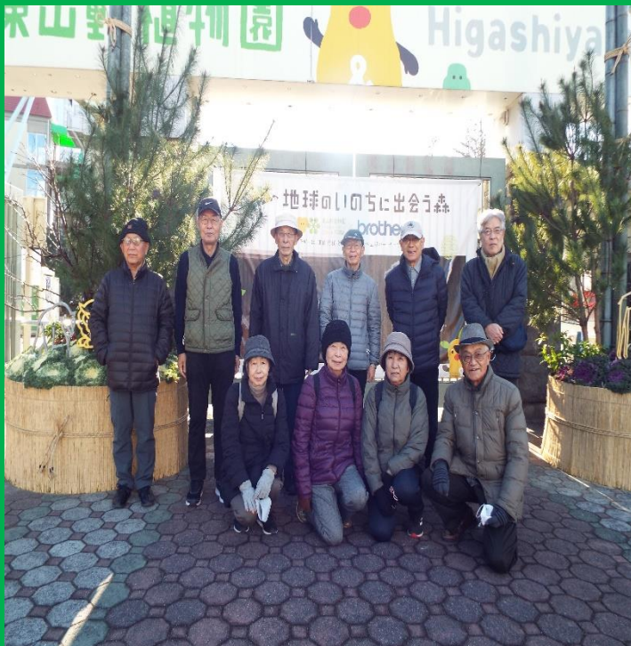
動物園出入口に飾るの門松の前にて