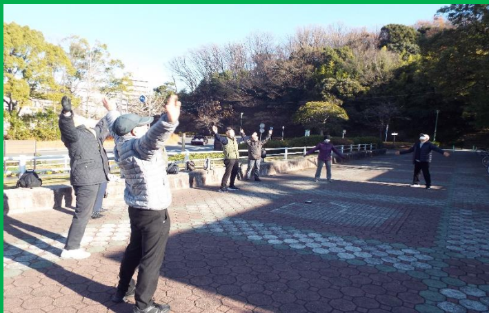
平和公園 1万歩コースを歩く前の準備体操