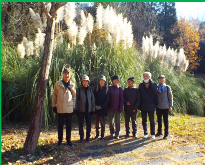
パンパスグラス前での有志による写真撮影