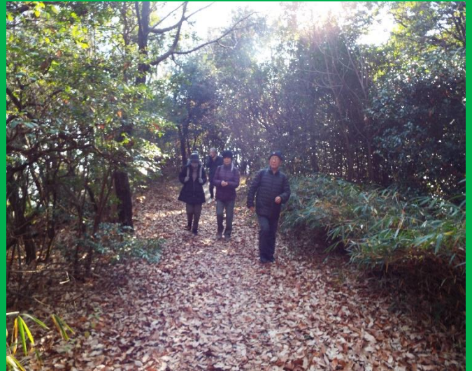
枯れ落ち葉の上をかサカサ音を立てて歩く