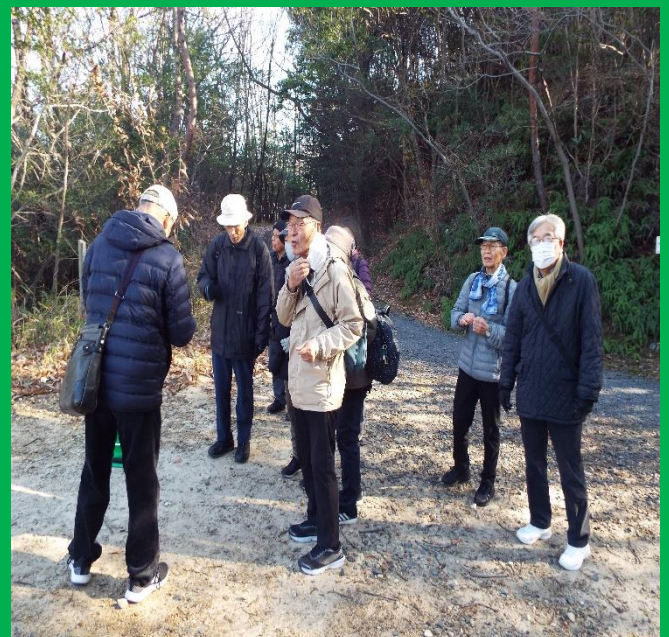
ウォーキング途中でのしばし休憩