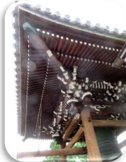
◇西連寺の「歎異抄」碑と隣の真宗大谷派圓明寺の鐘楼