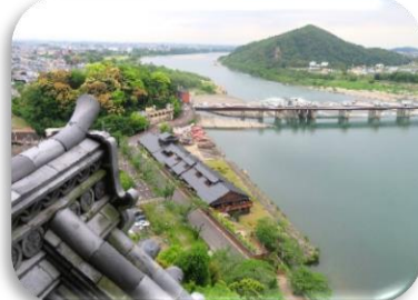
◇天守閣から西側(犬山頭首工)