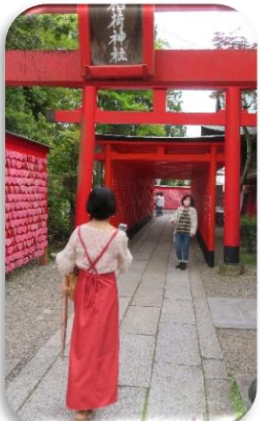
◇犬山城の南側「三光稲荷神社」