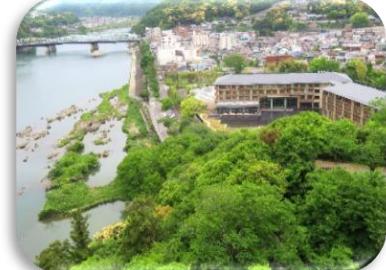
◇天守閣から東側(ホテルインディゴ犬山有楽苑)