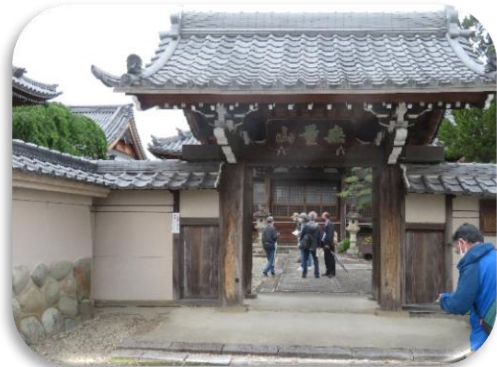
◇真宗大谷派の「西連寺」正門

◇犬山城は室町時代の天文6年(1537)建築された国宝天守5城の一つ(他に姫路城・彦根城・松本城・松江城)