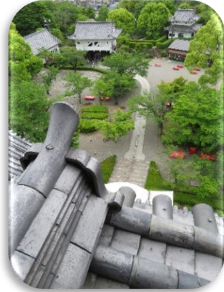
◇犬山城天守閣から南側(正門)