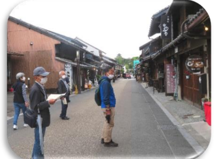
◇店舗の多い城下町の「本町」通り