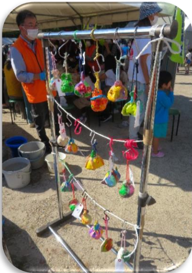
◇絵付けした土鈴にラッカーシンナーを吹き付けて乾燥中(100円/個)