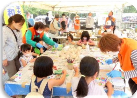
◇「土鈴の絵付け体験」は素焼きした土鈴にアクリル絵の具で彩色