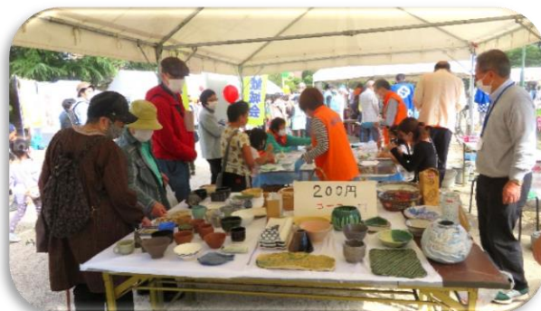
◇手作りの陶芸品を展示販売。 100円/個~