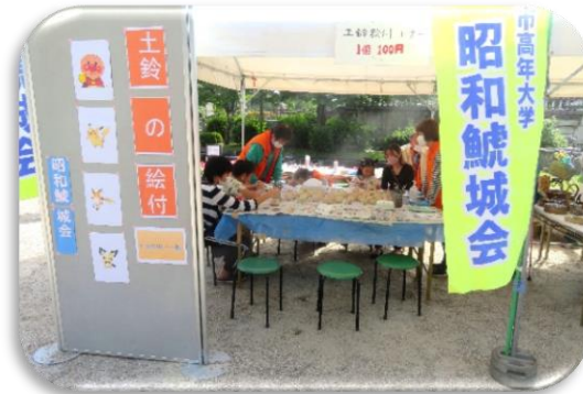
◇昭和鯨城会ブース正面出入り口