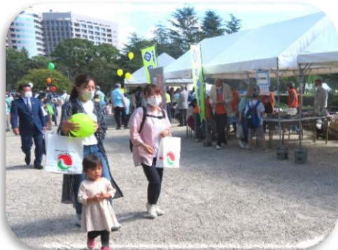
◇昭和鯨城会 N.30 ブース前