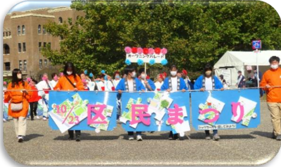
◇奏楽堂でオープニングパレード