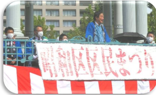
◇奏楽堂でオープニングセレモニーの河村市長挨拶