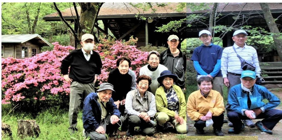
参加者記念撮影: 森林交流館

午後から降雨の天気予報であつたが、出発時は薄い日差しもあり、その後は曇り空で、雨は名古屋に帰るまでまったくなかつた。