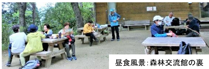
昼食風景: 森林交流館の裏