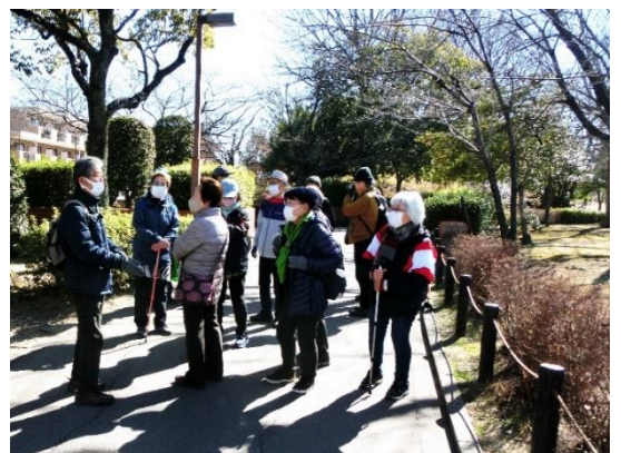
杵ヶ池公園駅に 向かう途中で 現地解散