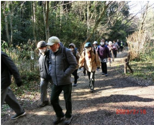
猪高緑地の散策開始