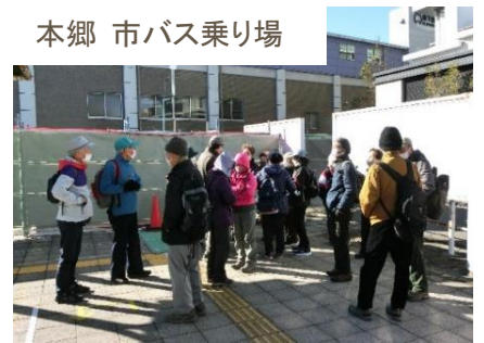
本郷 市バス乗り場