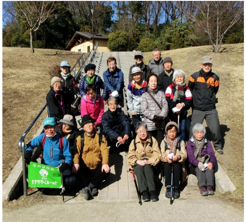
参加者全員で集合写真 於:長湫南公園