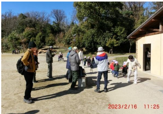
長湫南公園 — 保育園児が散歩していた。