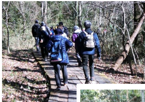
枕木道の登りの前の平坦な散策路