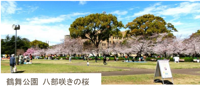
鶴舞公園 八部咲きの桜