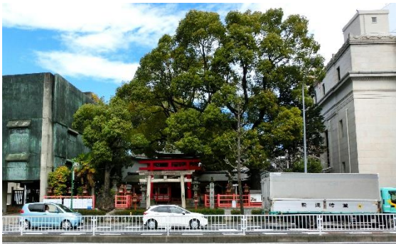
上前津 交差点の 西にある 春日神社