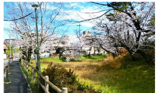
八幡山古墳 周囲には桜が植樹されている