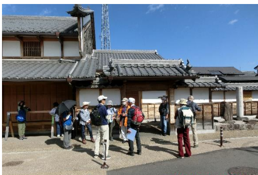
脇本陣玄関、(右側)芭蕉の句碑