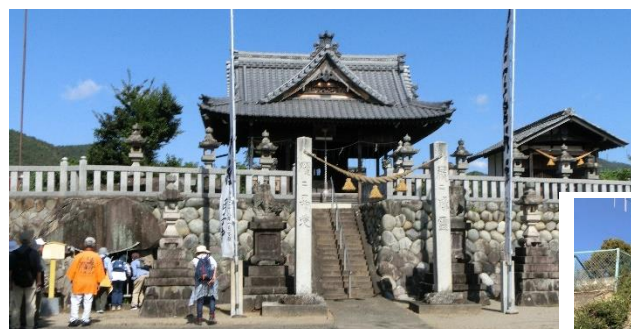
(正面)二之宮神社 社殿:古墳上にある (左側下)古墳、(右側)二之宮神社 入口階段