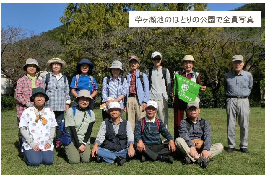
苧ヶ瀬池のほとりの公園で全員写真