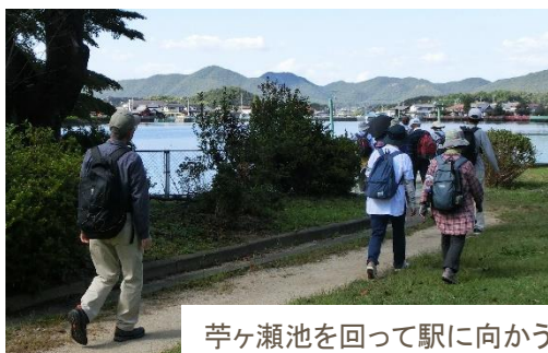
苧ヶ瀬池を回って駅に向かう