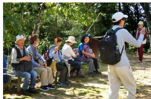
愛宕神社境内で休憩