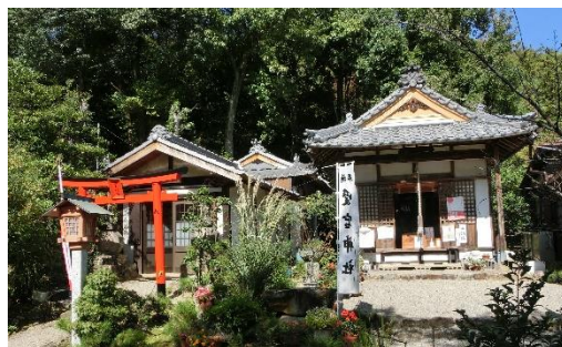
(左)愛宕神社入口、後方:愛宕山 (中)愛宕神社社殿