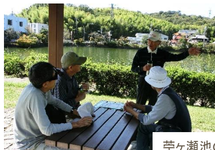
苧ヶ瀬池のほとりの公園で昼食