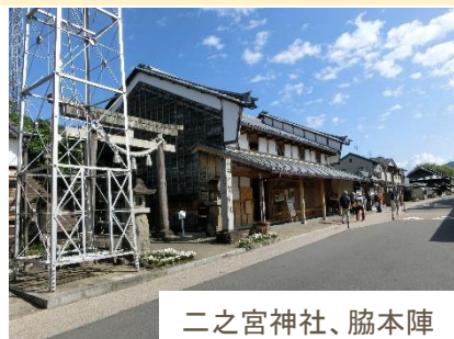
二之宮神社、脇本陣