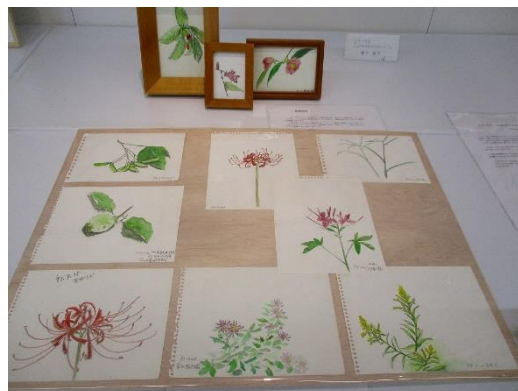
精密なボタニカルアートが多い