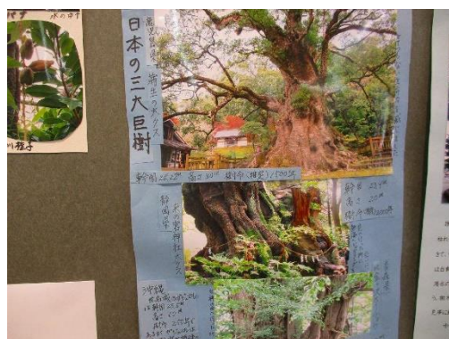
説明して貰ったガイドさん 三大巨樹 鹿児島県 岐阜県 秋田県まで