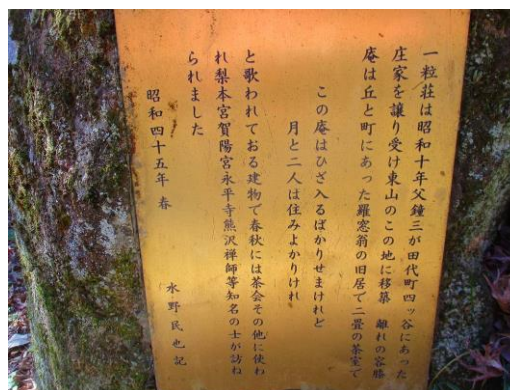
星ヶ丘門閉鎖で、迂回の道に一粒荘跡 説明碑 水野家茶室で名士達が来客と