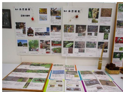
とにかく凄い！の一言に尽きる