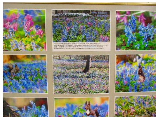
エンゴサクを求めて何処までも