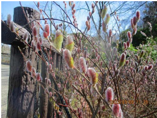
花園橋渡ると ピンクネコヤナギ