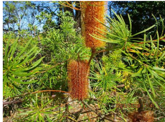
フォークダンス広場 グレビレア各種