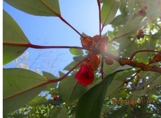
シャクナゲモドキ 中国産園にて