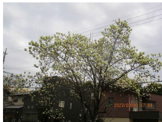
自由ヶ丘駅南のシロモクレン 今の時期は、別れと旅立ちです さようなら わが友よ