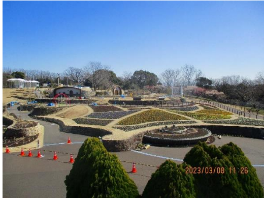
お花畑は工事中ですもう少しです