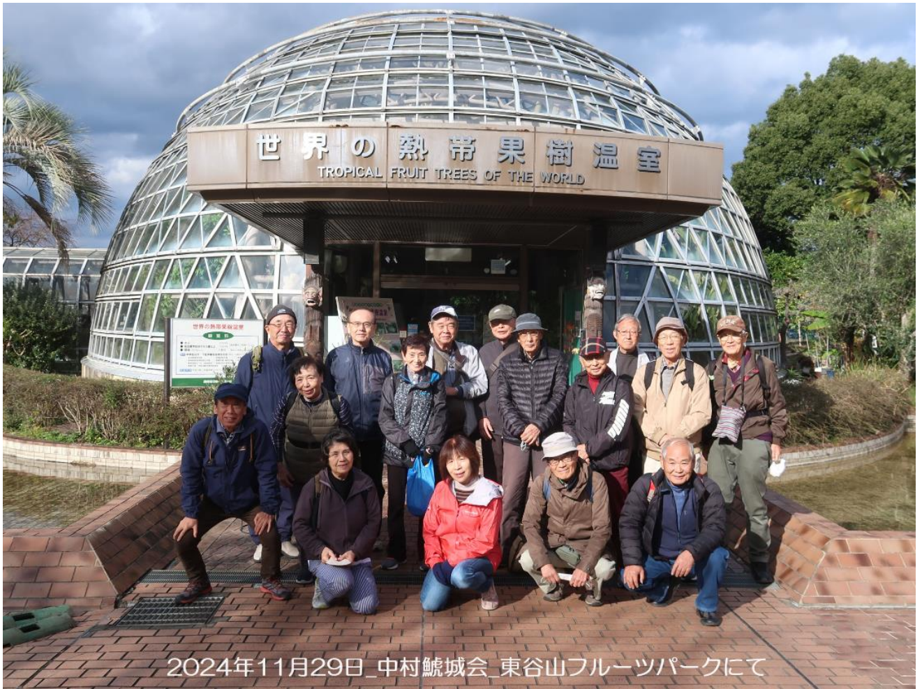
2024年11月29日_中村鯨城会_東谷山フルーツパークにて