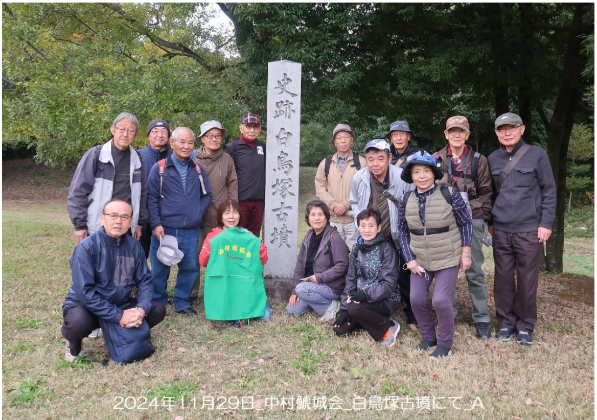
2024年11月29日_中村鯨城会_白鳥塚古墳にて_A