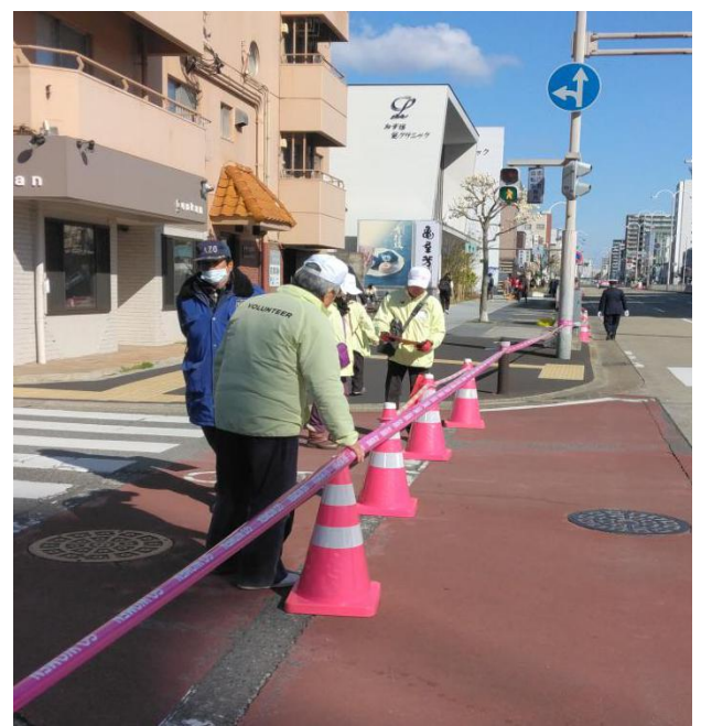
手際よく規コーンとコーンバーの設置