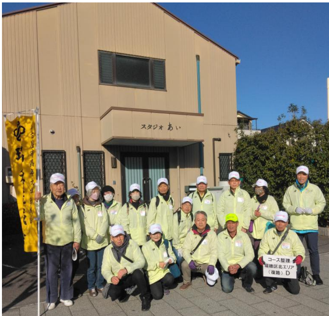
レモン色のユニフォームを羽織って記念撮影