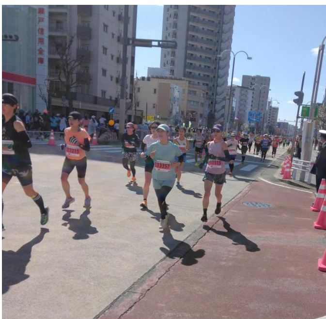
春の日差しを受けて風になって走り抜けるランナー