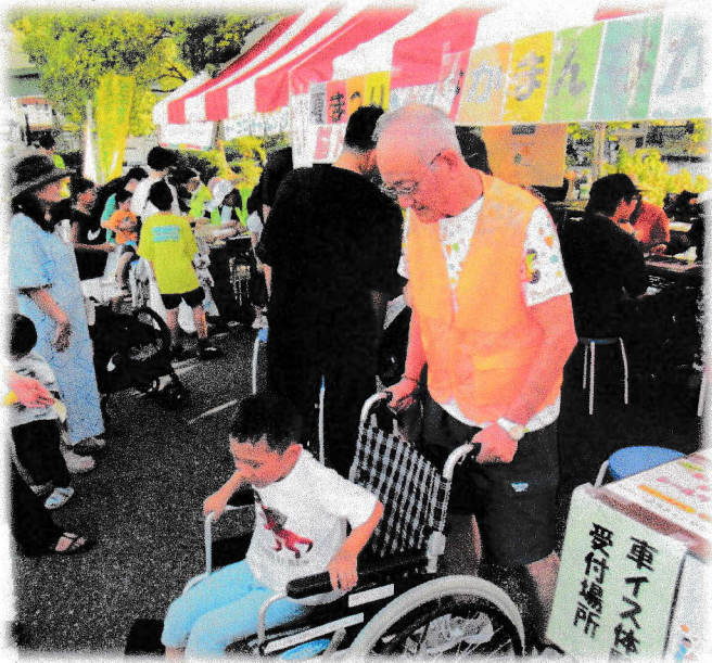
東別院なつまつり (ボラネットなかまんなかの一員としてブース出展)