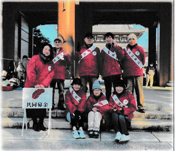
赤い羽根共同募金 街頭募金運動