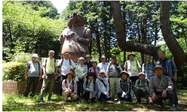
大きなたぬきのやきもので集合写真