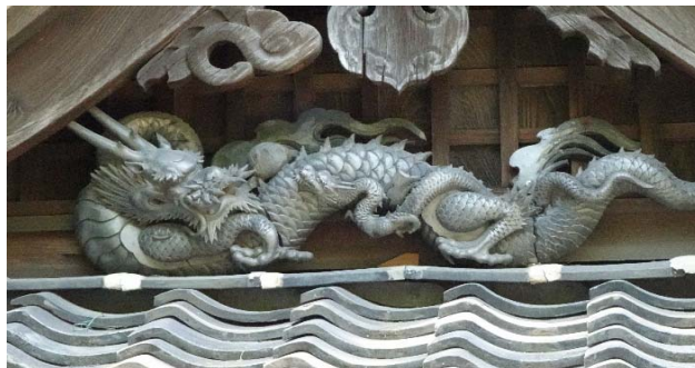
見事な龍のやきもの