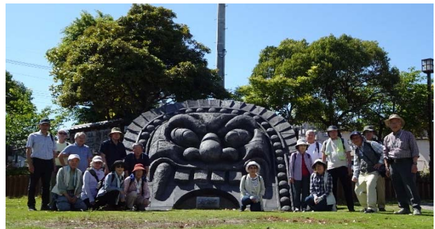
巨大鬼瓦で写真を取り終点です。