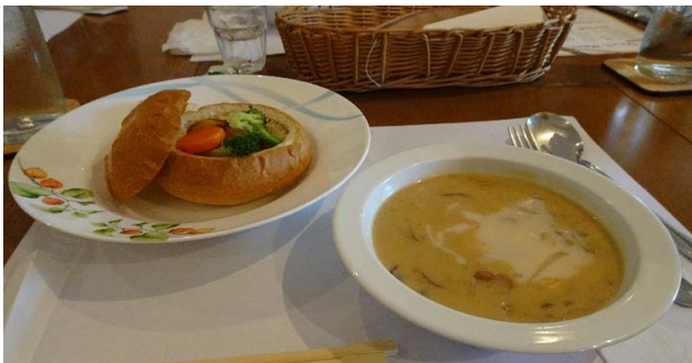
かわら美術館のランチ ちょっとおしゃれなレストランで おいしく楽しい時を過ごしました、