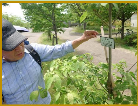
高年大学園芸緑友会、発足20周年記念植樹の プレートを説明するメンバー