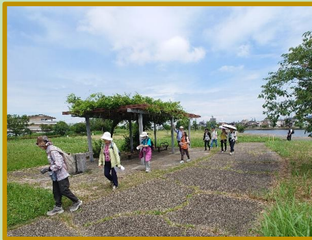
広い園内を散策する