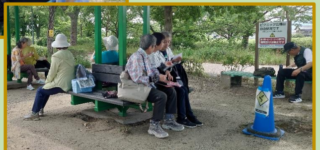
楽しい昼食タイム