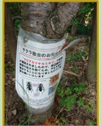
害虫の被害で伐採する木も