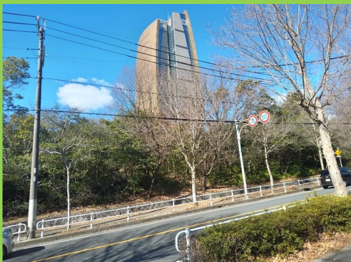
平和公園、「アクアタワー」(平和公園配水場)の全景