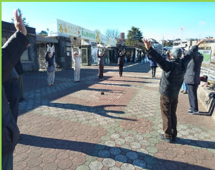
恒例の準備ラジオ体操で今日が始まる。体が硬い