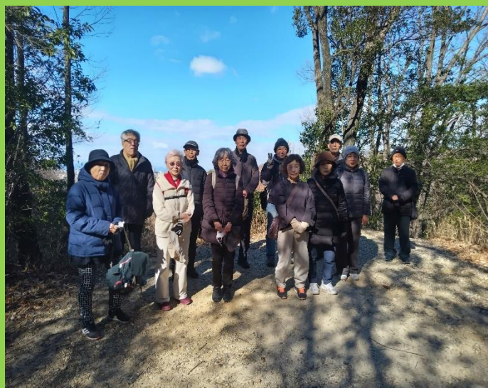
開けた場所での全員の顔、背景には駅前ビル群が