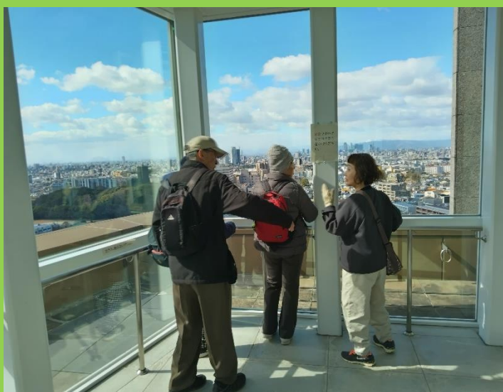
アクアタワーの展望室より南西側を望む。はるか前方には、駅前のビル群が眺望できる。