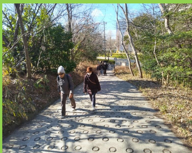
コースの入り口のため足取りも軽くウォーク