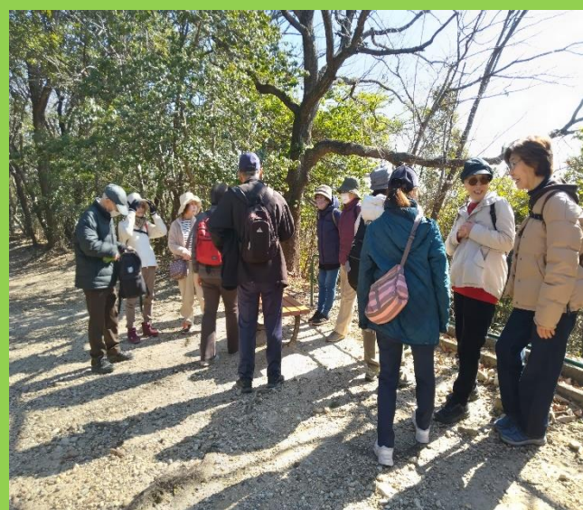
第二休憩所でしばし休憩、やれやれです！