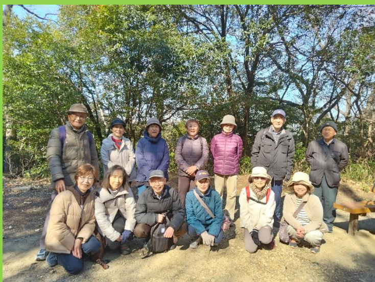
長い坂を登り切った第一休憩所での全員