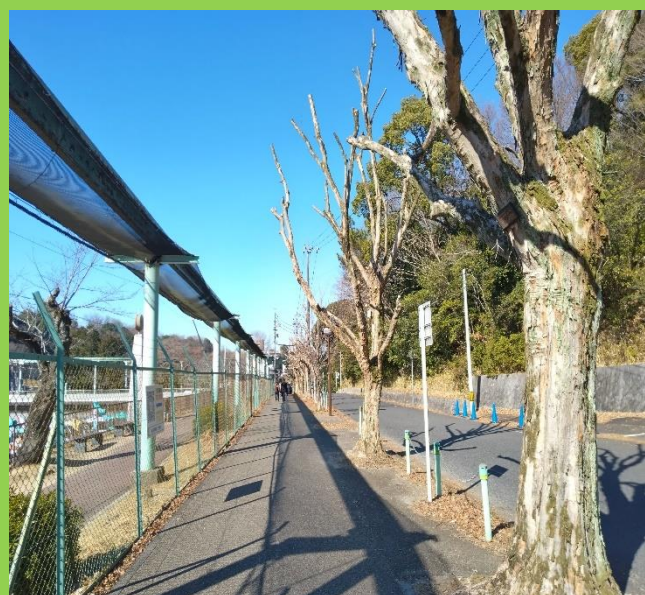
秋には素晴らしい「藤カエデ」の紅葉が、今？