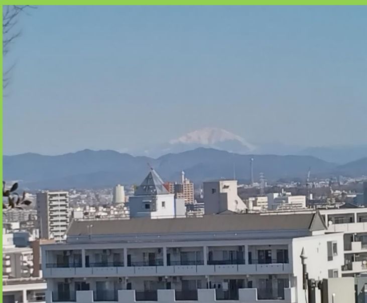
澄み切った青空にくっきりと冠雪の「御嶽山」が