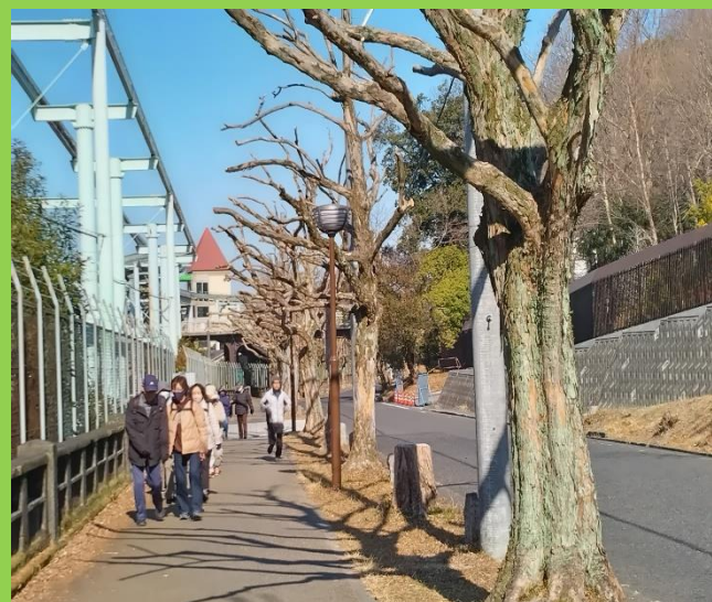
藤カエデ(葉の無い)の道をウォーク