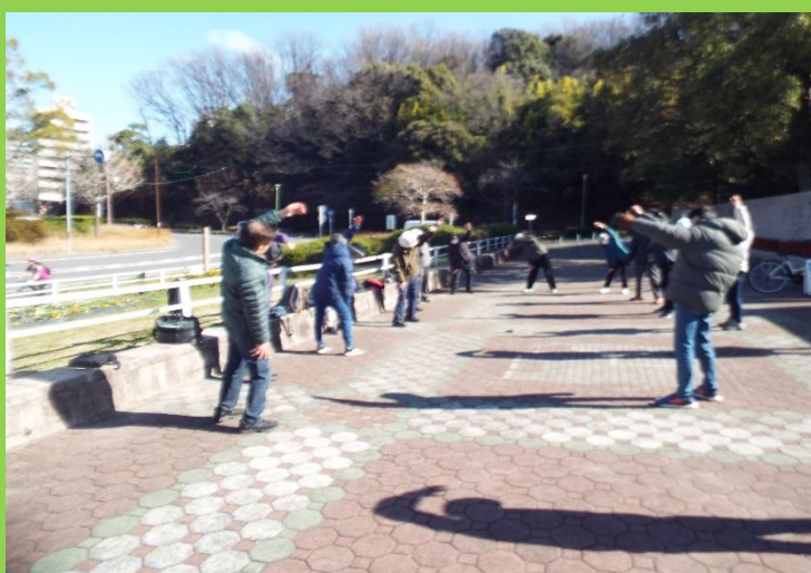
恒例のウォーキング前での準備体操(NHK)