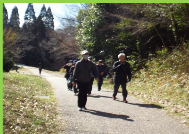
同じく足取りも軽く歩き続ける第2群の皆さん