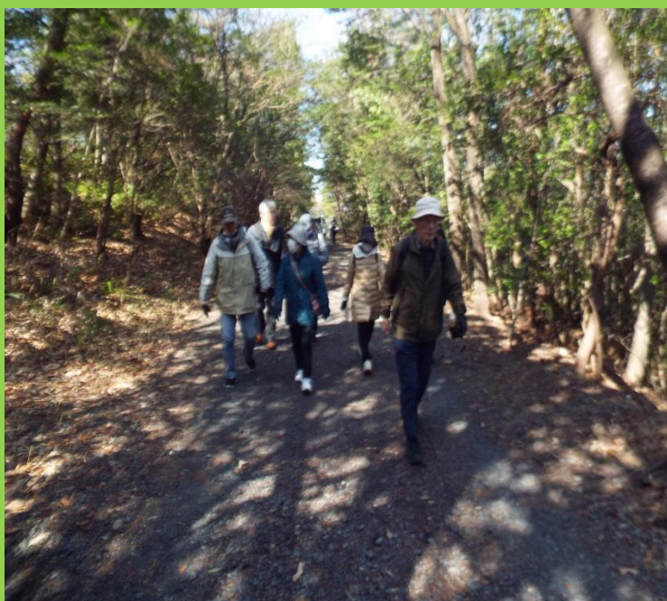
各人談笑し合いながらのウォーキング何よりも楽しい