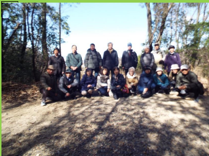
歩きだして1回目の休憩、背景には駅前のビル群が？