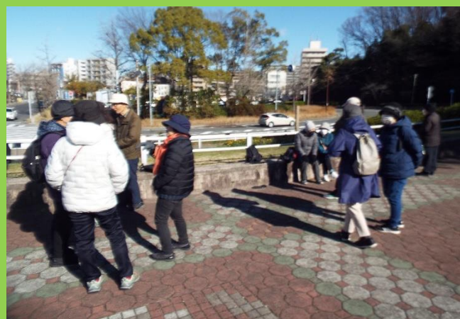
午前9時半集合前でのそれぞれの談笑