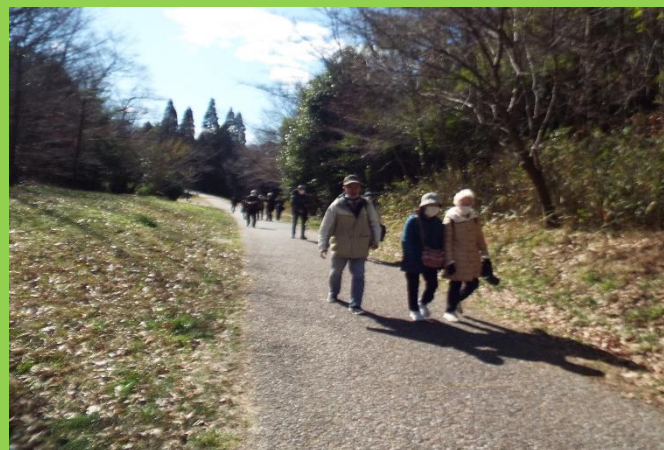
足取りも軽く歩き続ける皆さん