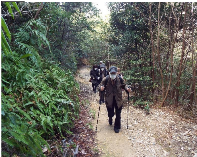
ステックを頼りに快適に歩く参加者