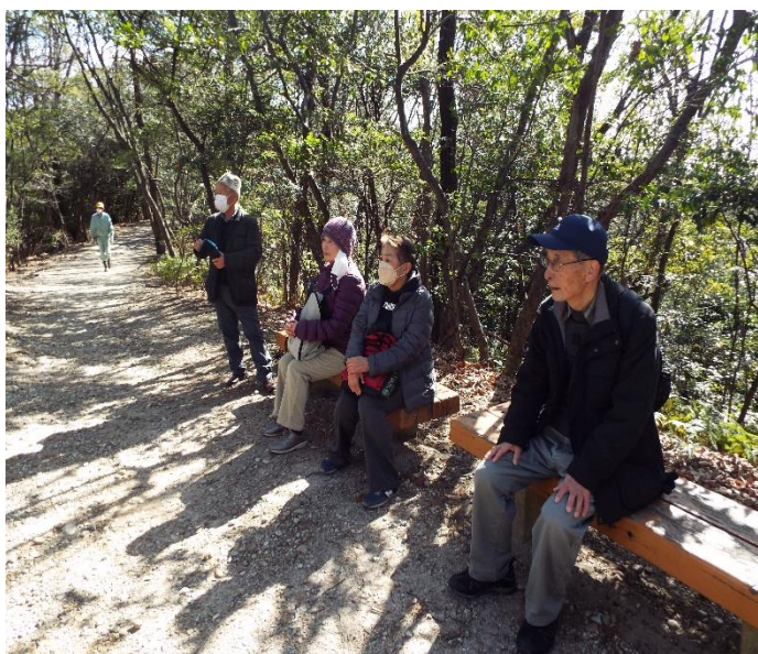
やれやれ一休みだ！ 後半のコースにて