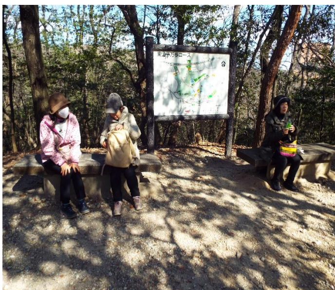
お茶を飲み一息入れる、後半コーカにて