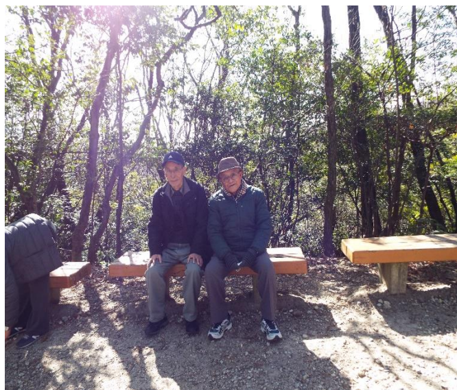
ああ～しんど、疲れたあ～？ 後半コースにて