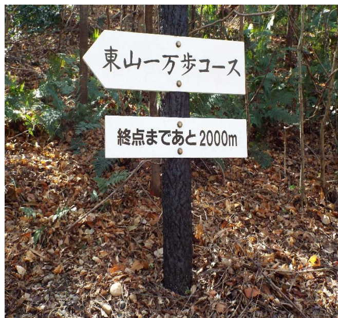
やれやれ後2千歩か、後半コースにて