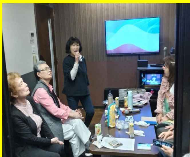
何時も著名な歌手の歌を選ぶ福田会長