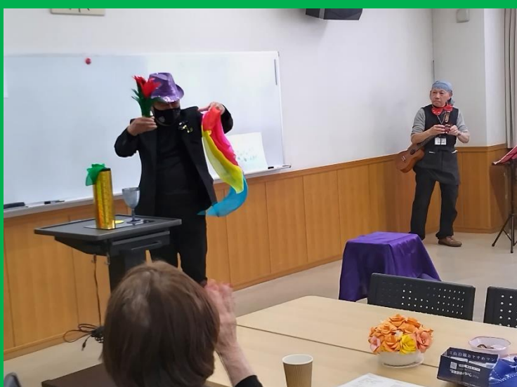
一色とりどりの布からたくさんの花を取り出した！