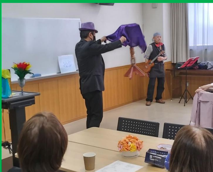
どうなってるの？ 上下、横にグルグル回し始めた？