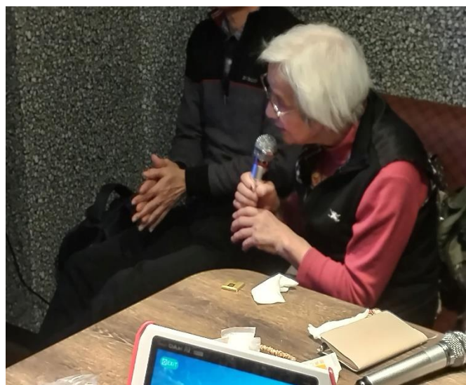
お歳召されても可愛い声で 坂さん(24期)