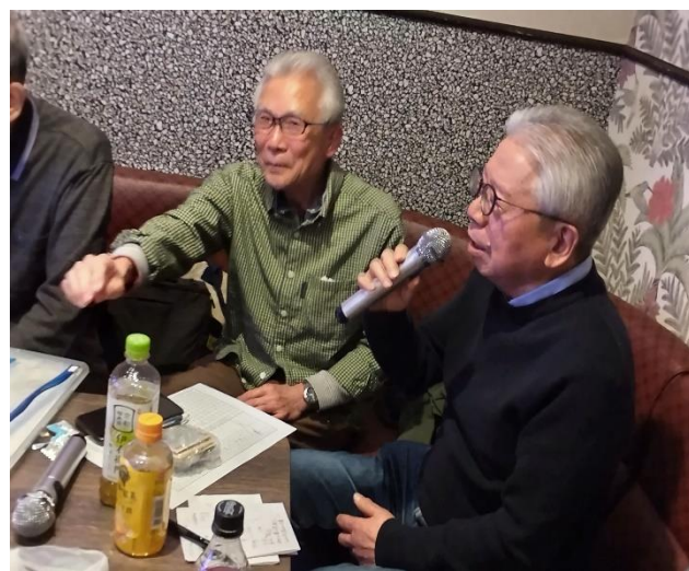
お歳に似合う常に若い歌を 山口氏(30期)