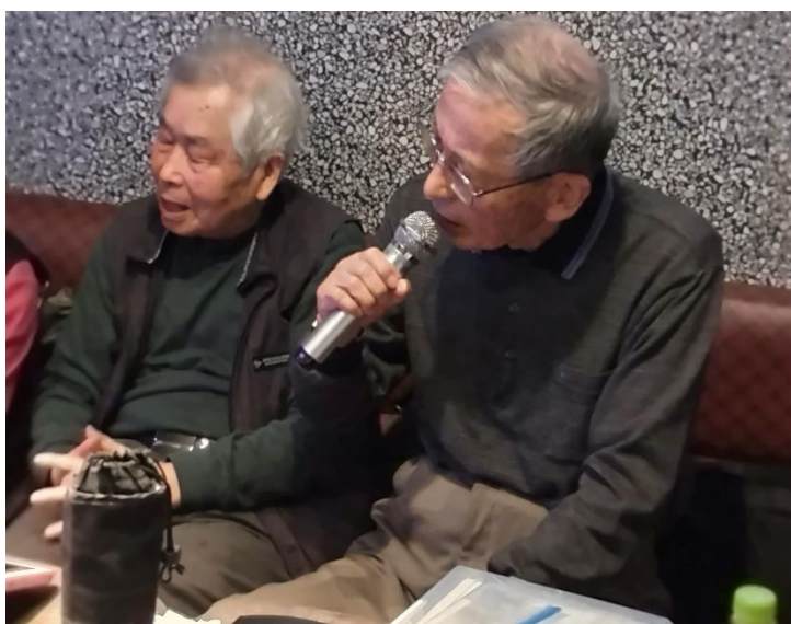
負傷で休み漸く待ちに待った 増田氏(24期)