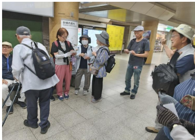
地下鉄「中村公園駅」にての待ち合わせ風景