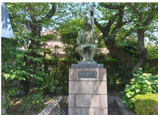
加藤清正公の造像 威風堂々の姿