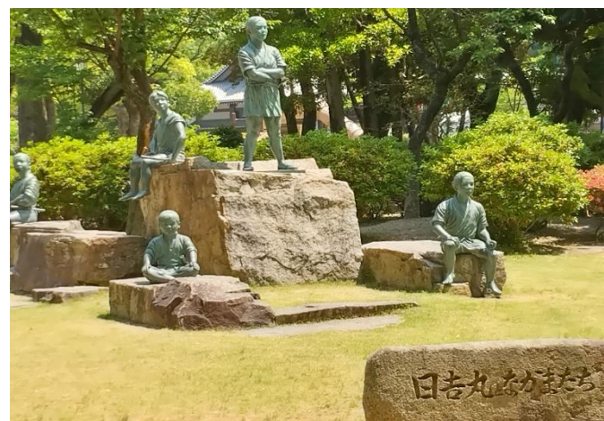
日吉丸の仲間たち(高いところ秀吉、右秀長)