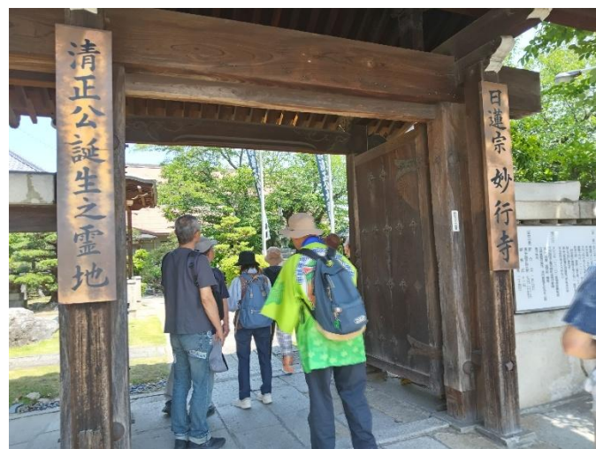
妙行寺の門前にて