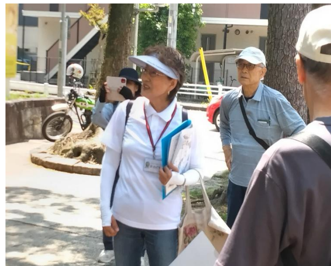
川口ガイドさんの解説風景 川口ガイドさんの解説風景