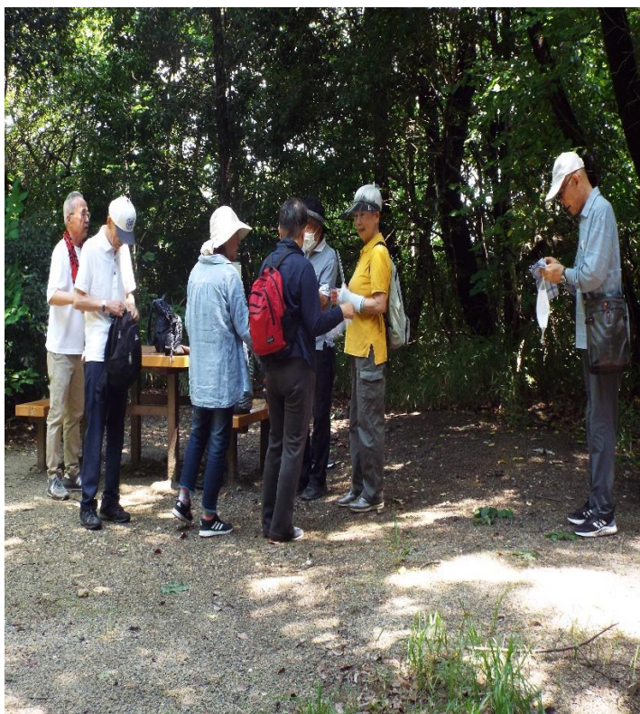
第一休憩場所での風景