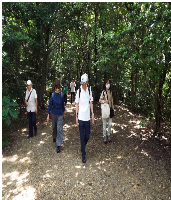
細かい石ころで多少歩きにくい？