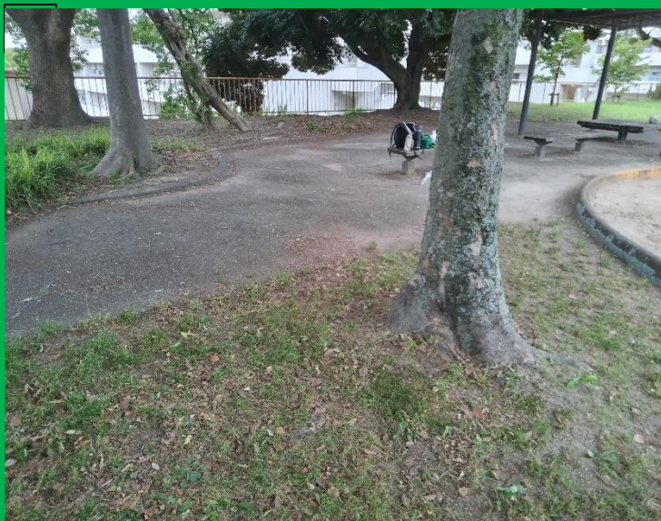
この場所は、最も枯れ葉の積る場所、今日は綺麗に