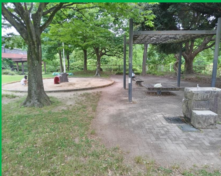
砂場あり、休憩場所あり、水飲み場あり、大変綺麗に