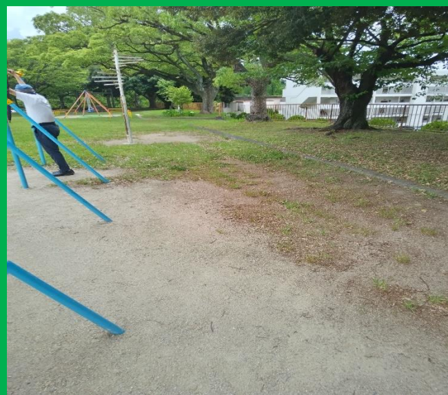
公園の北側にある2つのブランコがある所