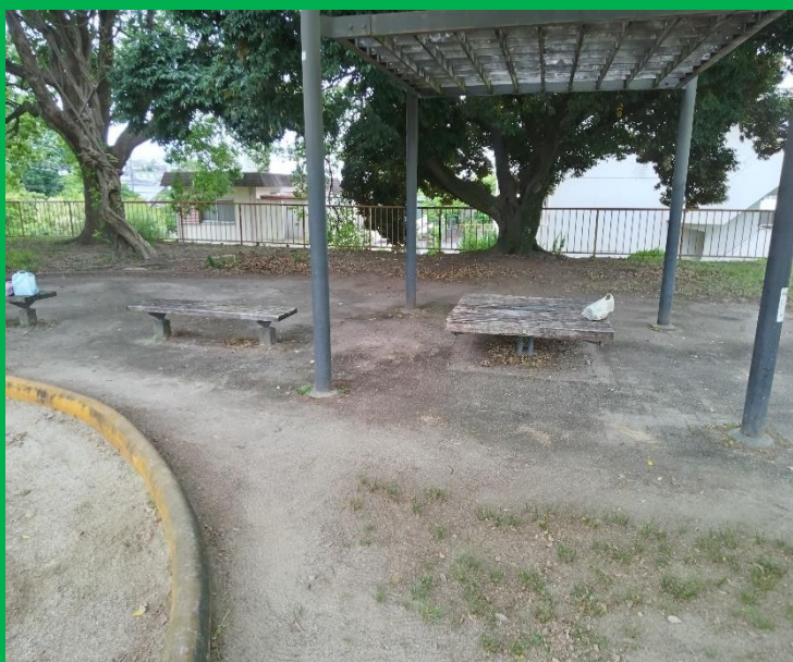
休憩場所、この辺りも特に枯れ葉が多い処