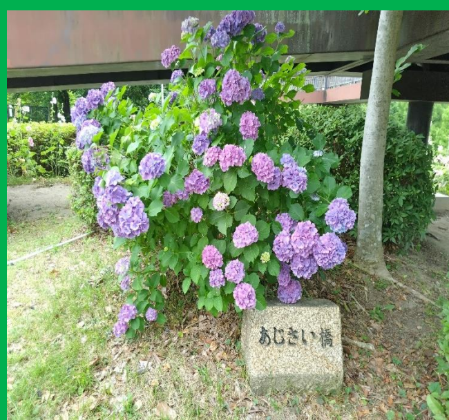
茶屋ヶ坂第3公園にある紫紫陽花、あじさい橋の麓