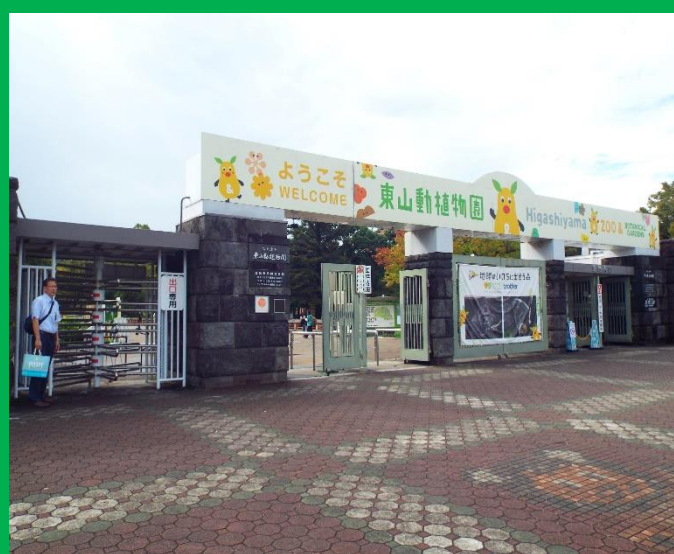
朝 8 時 55 分頃の動物園の入り口風景