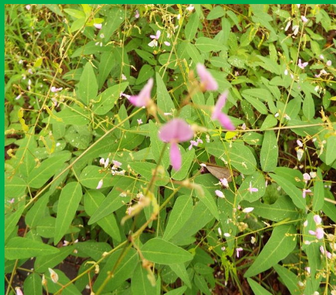
動物園横のロードに咲き誇るアレチヌビト萩