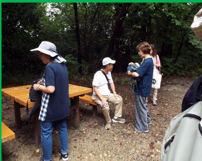
途中の登りきった所でしばし休憩(飴玉の配布)