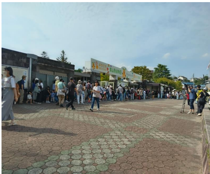
TV局が群衆にインタビューをしていた。 午前 8 時 45 分ごろの風景