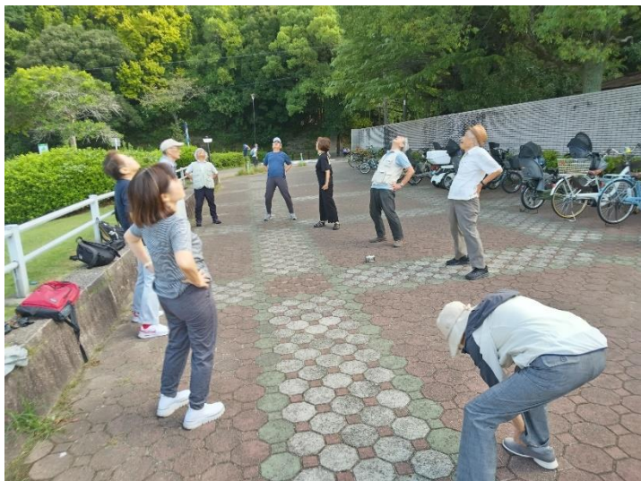
ウォーキング前の準備体操(NHK朝の体操)