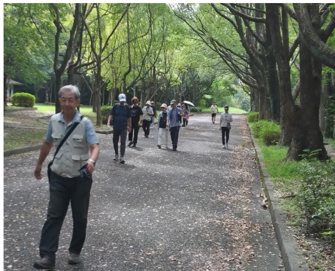
杉本氏の快調な足運び、休憩後の足取り軽く