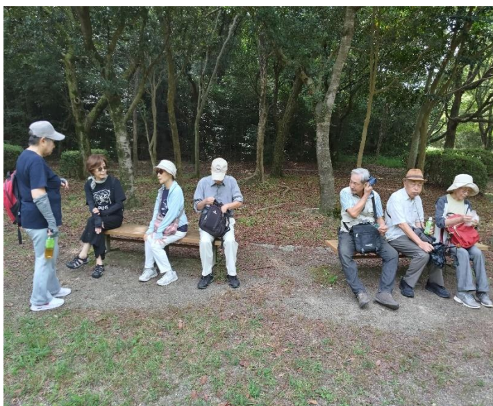
途中の休憩系風景、懸命に歩くので汗も出る