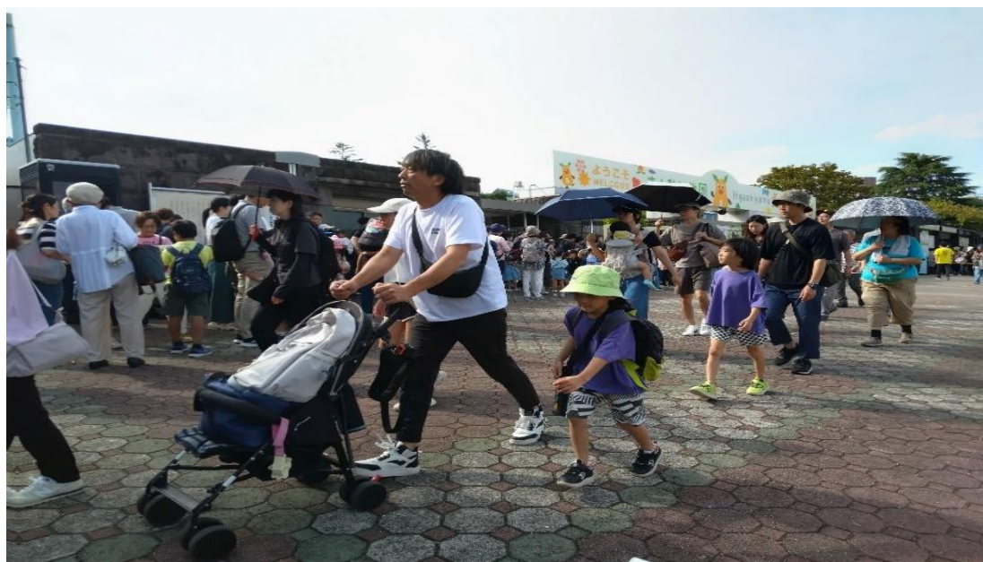
どんどんと来園する風景。この数分後、この広場が 2,3 重の列となり すさまじい人・人・人となる。