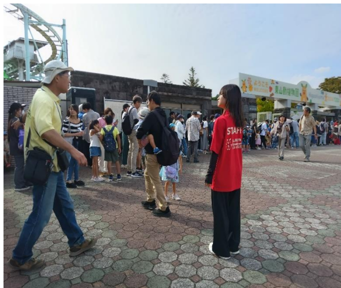
動物園の係が出て整理を始める。黄色・赤色の方 午前 8 時 50 分ごろの風景