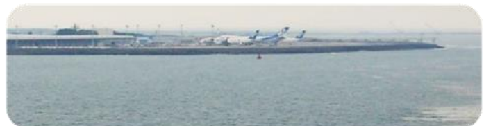
海上からの那覇空港

翌朝、頻繁に離発着する那覇空港を海側から眺めながら那覇港に入港。中々見る事の出来ない風景を堪能できました。