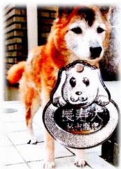
長寿犬メダル元を付けた 中型犬 プリン

娘と二人で「もういいんだよ楽になりなさい」と頭をなでてやると安らかな顔になりました。あくる日、容体の異変に気づき家族全員を呼びました。真っ先に駆けつけてくれたのは、高校生の孫でした。プリンがこの子にお乳を含ませようとしてから17年の歳月がたっていたのです。当然一番の仲良しでした。もしかするとプリンはこの子がわが子と思っていたかも？かけつけた孫は男の子ですがプリンを抱いて泣き崩れました。泣き崩れる孫を見て、全員声をあげて泣きました。安らかな最期でした。それから十日後、表彰状とメダルを受け取りました。