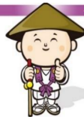
イメージキャラクター