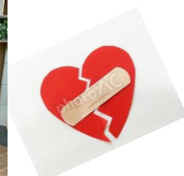
左：参加ボランティアの皆さん 右：配布開始前のウォームアップ

9 月 13 日 千種駅の地下鉄と JR を結ぶコンコースで、「こころの絆創膏キャンペーン」に参加し、通勤・通学客に絆創膏を配布してきました。