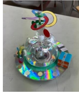
上：今回の完成おもちゃ 右：先生頑張っています

7月29日「つくってあそぼう！」イベントに参加しUFOを作りました。回転をアンバランスにしたモーターの振動で、歯ブラシのブラシ部分でできた足が動き出すという何とも不思議なおモチャです。自由勝手に動き回り、子供たちはさぞビックリしたことでしょう。