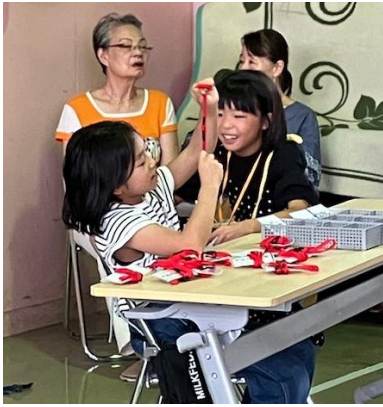
上：アルバイトあっせん所 右：ワイワイ食堂 順番待ち