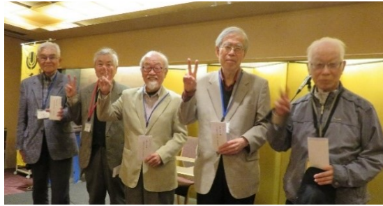
10年継続会員の元気な皆さん