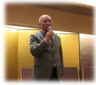
小松相談役による三本締め