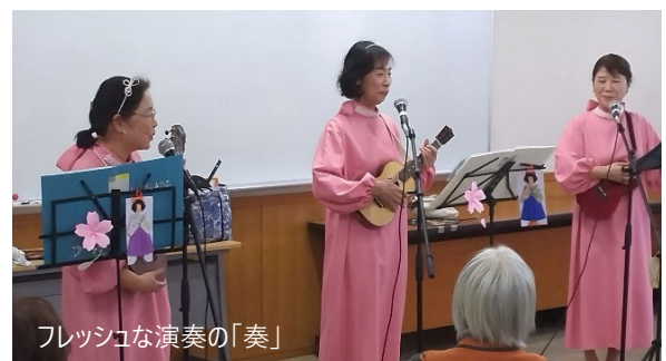
フレッシュな演奏の「奏」

中日新聞に取り上げられた、鯉城学園OGのウクレレトリオ「奏」が3月4日のコーヒーサロンでデビューしました。お揃いのピンクの衣装、譜面立てにもかわいいイラストをあしらい、ステージ映えを考えた演出で楽しませてくださいました。演奏も楽しそうで、ぜひレギュラー出演していただきたいグループでした。