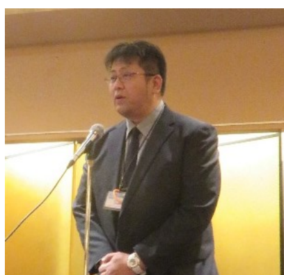
千種区社会福祉協議会 光森局長様挨拶