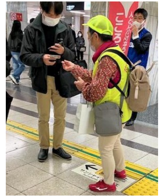
委員長 配布頑張る

帰宅時間帯の栄のラッシュは相当なもので、お勤めの方、学生さん、旅行の方、遊びの方などが行き交い、アツという間にノルマ100枚を配り終わりました。200枚でも行けたかもね(余裕)。