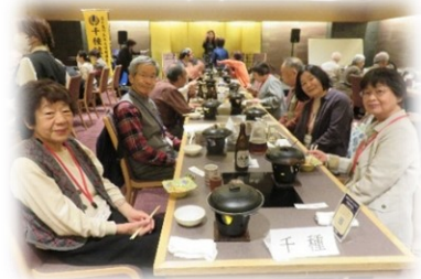
満席の会場での会食