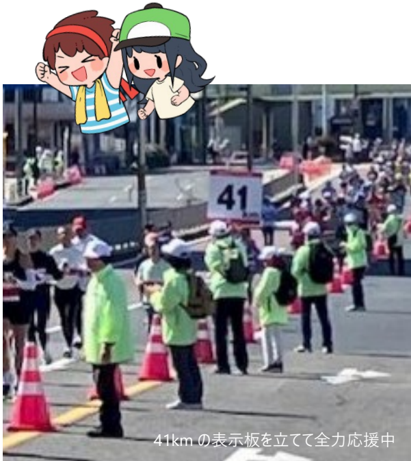
41kmの表示板を立てて全力応援中

今年もゴール直前の41km地点で、コース整理を担当しました。春とはいえ風が冷たい中、1人も落伍者を出さず、30人全員で大会終了まで勤めました。