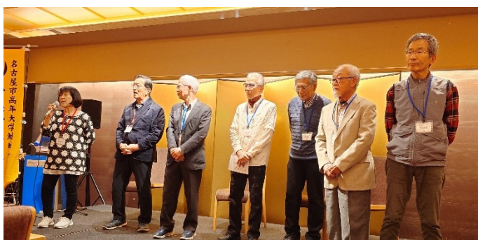
仲良し地域長7名が「各地域会の紹介自慢PR」