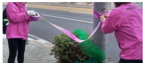
コーステープの取り付け作業をする