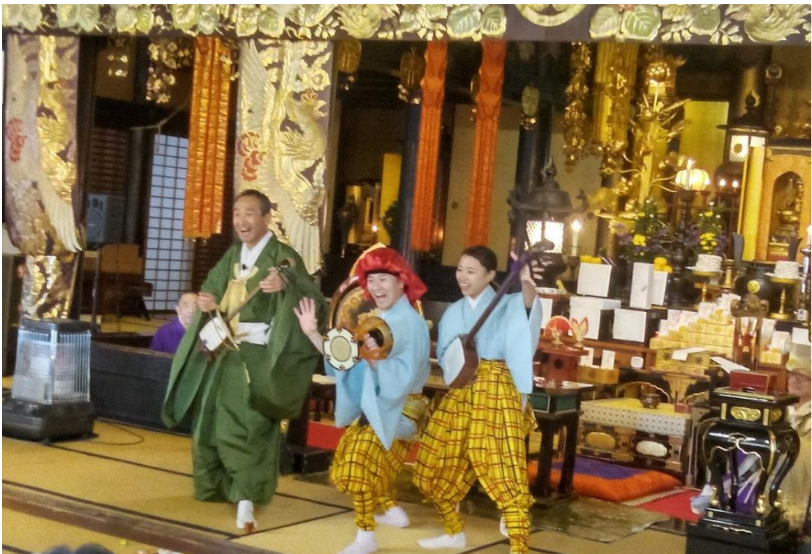
建中寺で尾張万歳