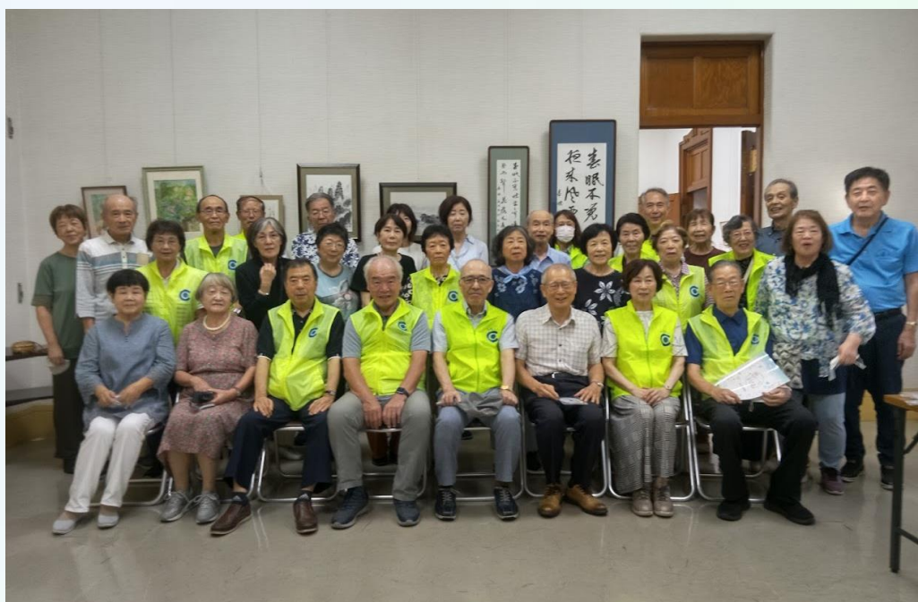
作品展が無事終わり安堵の笑顔