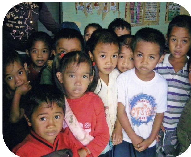
目の輝きが印象的だった現地の園児