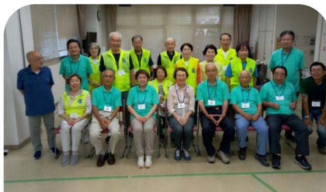
熱戦後に北鯨城会の皆さんと