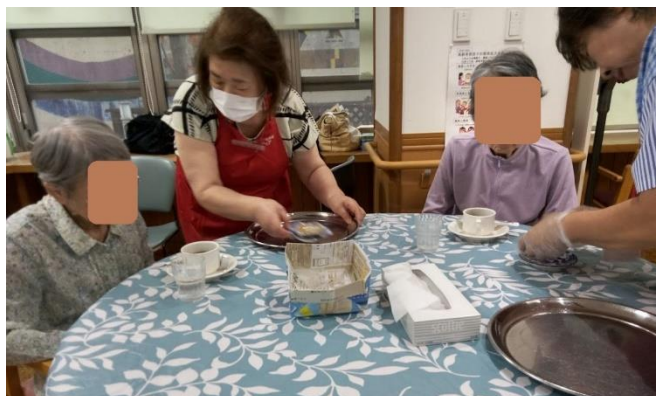
おまかせしました『ハイ！どうぞ・・・』