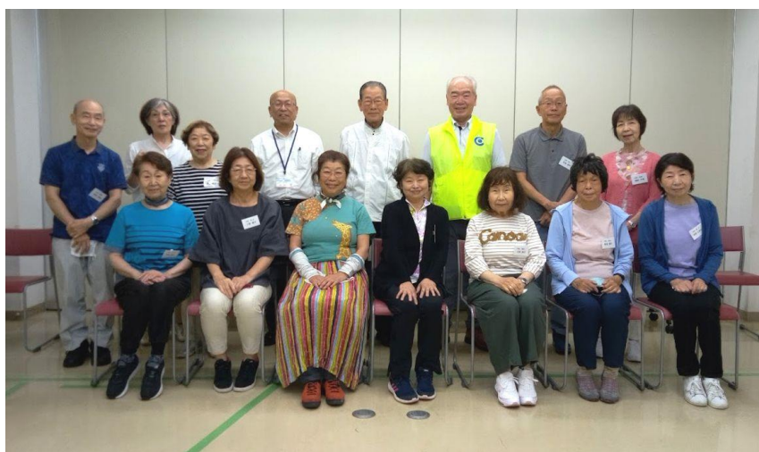
38期生の皆さんと笑顔でハイポーズ！