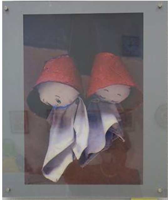
37 晴娘 24期 大上節子様