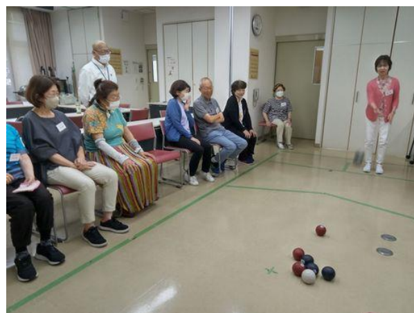
ポッチャで和気あいあい