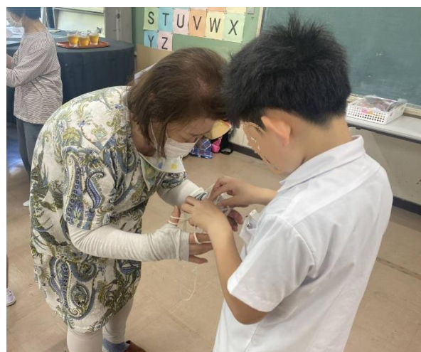
出来るまで熱心に体験しました