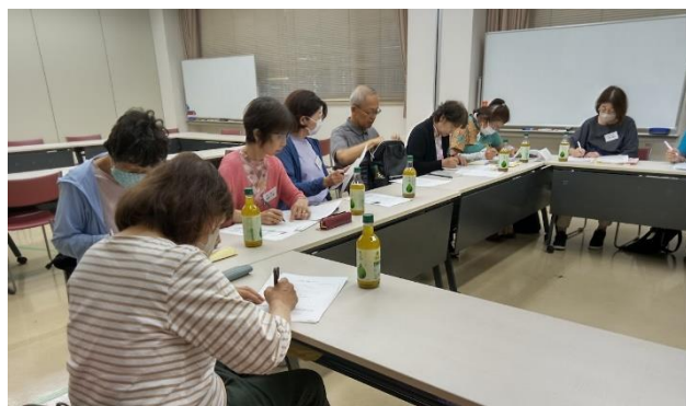
熱心な38期生の皆さん

7番目の方の自己紹介スタートが冒頭のセリフ。 皆さんあっけにとられ一瞬の静寂・・・そして全員が大爆笑！ 緊張していた会場の空気が一気に和み、その後のポッチャも和気あいあいと進んだのは言うまでもありません。令和7年度の新規入会者を楽しみに待てる、有意義な地域ミーティングとなりました。