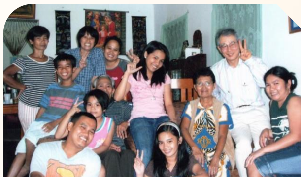
フィリピンの大家族の ホームステイ先で

今後も、様々なイベントや募金活動に参加することにより、オイスカの理念に沿えればと思っています。