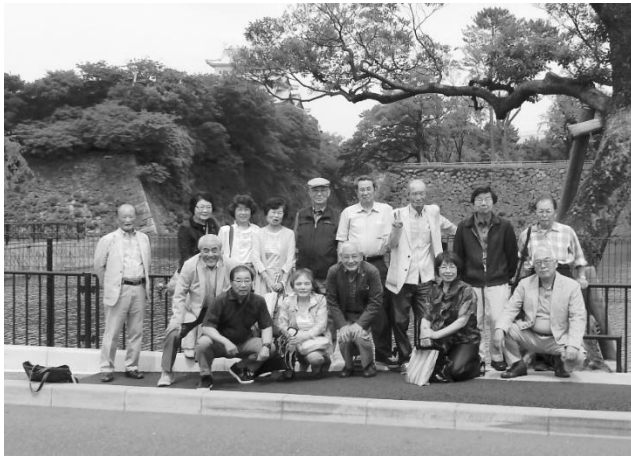
食事を終えて堀端で

現在会員は13期から30期まで、幅広いのが特徴です。最高88歳の方が見えます。会員数29名、30期生は2名入会していただきましたが、5名の方が退会され残念です。鯉城会のあり方に問題があるのか、みんなで考えたいと思います。