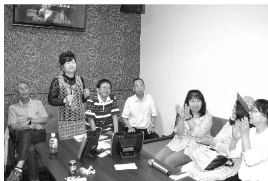
楽しく歌う皆さん

以上の方が参加され皆さん楽しんでおられます。歌が好きでカラオケに興味のある方、この機会に是非カラオケクラブにご参加下さい。