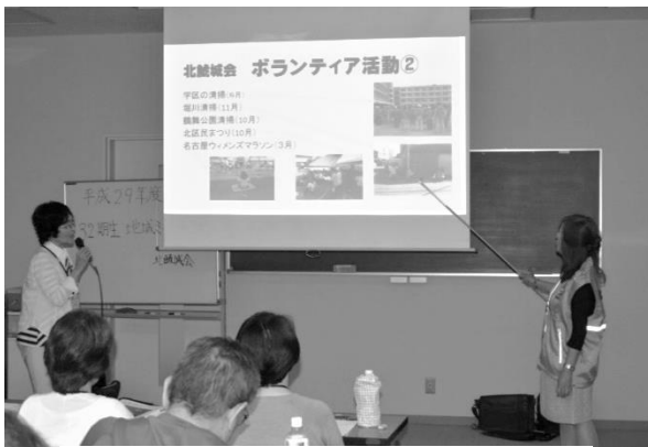
パワーポイントで説明

本年は4月11日に入学式があり、いよいよ高年大学鯨城学園の生徒として胸を張っての学生生活が始動しました。新しい仲間を迎えるこの時期は何か我々にもフレッシュな気分を感じられます。入学して1か月経過した頃に32期の皆さんに「第1回地域ミーティング」開催の通知が発せられ、学園の設立の趣旨である「高齢者の生きがいつくりと、地域活動の核となる人材の養成を目的とする」の理念の理解をすべきガイドラインも示された。卒業生の組織である鯨城会・区鯨城会を中心に趣旨の実現のために活動しています。