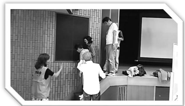
地域ミーティングでのアイマスク体験の様子

そうした状況のなか、上記のような講座や体験を通して、高齢の方や障がいのある方について知っていただくことで、区内の地域にお住まいの北鯉城会のみなさまと本会が、ともに手を携え、本会の活動計画の基本理念である、『誰もが健康で安心して住み続けられるまちづくり』を進めていきたいと存じますので、今後ともご指導・ご協力賜りますようお願い申し上げます。