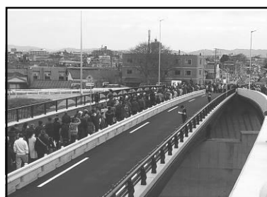
平成 29 年 3 月 25 日 三階橋開通式風景