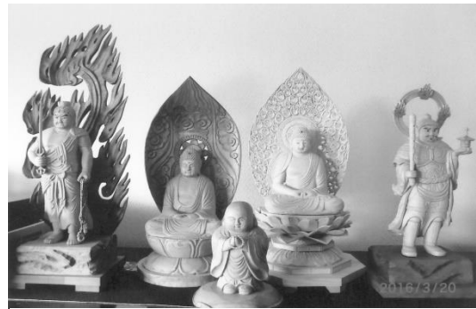
今まで制作した仏像の数々

講座初日に4分小刀（彫刻刀）、物指、造作鋸、木（練習用）を購入し、手始めに基本となる一番多く使用する小刀（印刀とも言います）の練習科目の「地紋彫り」を練習します。小刀をタテにヨコに、上から下に、下から上に右から左、左から右と木と喧嘩しない様に小刀の使い方を学びます。木には順目、逆目があり手前から向こうへは比較的容易ですが、逆に奥から手前に削る時は刃先が自分の体のほうに向いていますので、刃先を親指で押さえて削ります。手元が滑るとケガをします。船底の様に頂点がきれいに合せられる様に修練し、刃の使い方と、木の癖を勉強します。