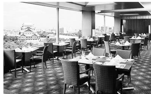
ホテル会場の様子

Hブロックでは、年2回食事会を開催しております。会員の方がお持ちの割引券を使って、値打ちに食事ができますのでありがたく思っています。