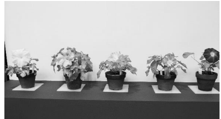
大輪で咲く名古屋朝顔

明治35年に会が創立され今年108回目の展示会です。名古屋発祥の名古屋朝顔種子、栽培技術を後世に伝えるため会員方々が努力しています。高年大学園芸学科、高年大学グリーンクラブ、名城公園花と緑の会、岩倉生涯センター朝顔教室、豊田竜神会と名古屋朝顔の栽培技術の講習会を開いています。