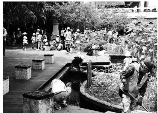
清水小学校の学童及び保護者の皆さん

北清水親水広場は北区役所の北側の北清水橋の真下にあります。まさに清水が大量に溢れ出ていて驚きました。ここは昔黒川船着場