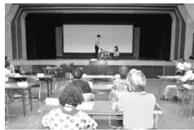
ボランティア体験講座

北鯉城会の概要説明の後、テーマである「ボランティア体験講座」に移り、認知症サポーター講座と車いす体験・アイマスク体験を社会福祉協議会職員から学びました。