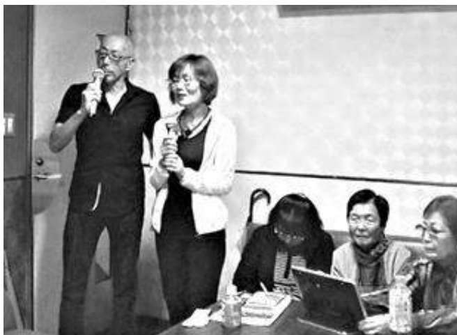
楽しくデュエット

上記開催日に自由な時間に入退室ができるようになっております。歌が好きでカラオケに興味のある方は是非この機会に、カラオケクラブにご参加ください。