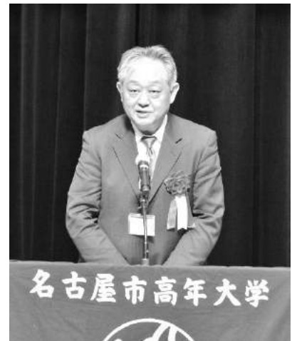
総会で来賓挨拶をする事務局長

北区社会福祉協議会としても、北鯨城会の皆様方の活動と連携して、地域の皆様が安心して暮らせる地域づくりを進めてまいりたいと考えておりますので今後ともより一層のご指導・ご協力を賜りますようお願い申し上げます。