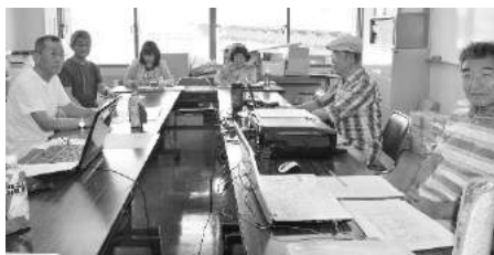
編集会議もウォッチングの場?

人間ウォッチングでは、表面的な観察だけではなく、話の内容からその人の心の中を読み取り、自分に役立つことは何か?を探し楽しむがある。現在の私は、高年大学のつながりから得られた様々な活動(クラスOB会、クラブOB会、地域OB会、健康マージャンの会等々)で、大変多忙な日々を過ごしています。それらの「人と人とのつながり」が 格好の人間ウォッチングの場 になっている。