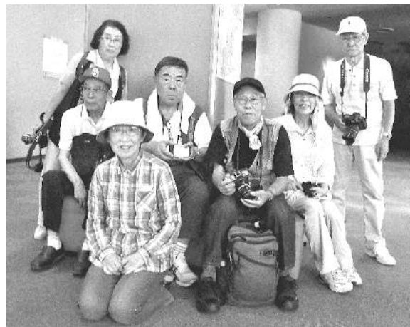
奇数月に撮影会を行います

経費は必要、経費節減、相反しますが努力しても、これが現実です。ひょっとして人生楽しく過ごしてみようと思う方がお見えでしたら、下記まで連絡してください。