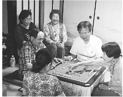
麻雀で人間ウォッチング?

ハイキングクラブのバス旅行中に「バードウォッチングより人間ウォッチング」と話しかけられた女性の方がいた。高年大学卒業後は「これだ!」と思った。教養と教育(今日用と今日行く)だけではなく、 充実人生 には、観察能力が必要条件である、と同時に自分の生活に役立てる工夫が充分条件ととらえた。以前、講演会で「貴方は、10~20歳以上離れた人と何人お話しできる方がいますか?」の問いかけを思い出した。私はトワイライトのボランティアで多くの小学生に手品を披露して、彼らとの会話と反応を楽しんでいます。また、女性職員の子供へのしつけは「さすが」とうなずかされる。