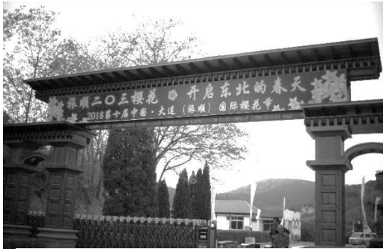
旅順 203 櫻花

今年の5月大連観光の1週間まえ、マスコミ報道で大連市内に北朝鮮の高級車軍団が現れた。翌日、中国の習近平主席が現れ中朝トップ会談と報道された。現地の混雑を心配したが、到着した時は平常に戻っていた。