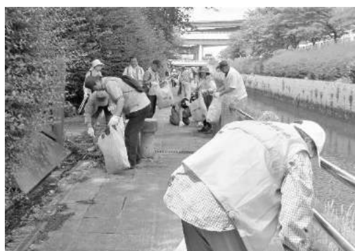
鯉城一斉美化活動（黒川沿い）

奉仕活動は翌年3月16日名城公園一斉清掃まで年14回あります。他に一部の方々の誠意で施設への定期訪問、囲碁、将棋、健康麻雀などのボランティア活動をしています。9月と3月には名古屋市健康福祉障害企画課主催「こころの絆創膏」の配布があります。絆創膏の絆の字は絆（きずな）と読み、悩みが小さい内に人との絆で手当てをしたいと言う想いを込めての名称で