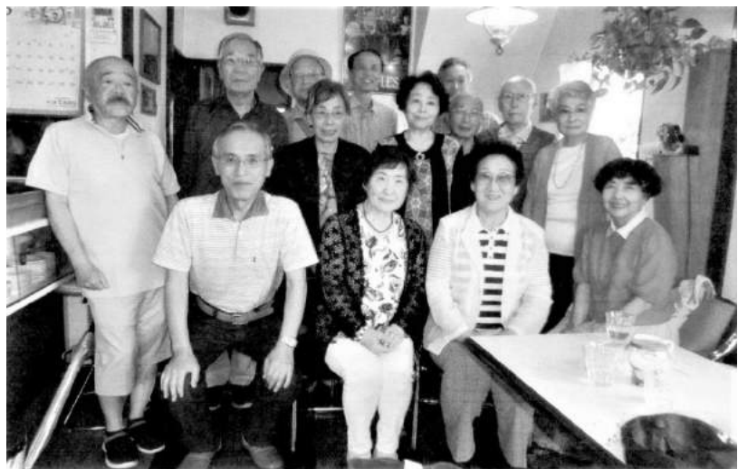
集会にはたくさん人が集まります