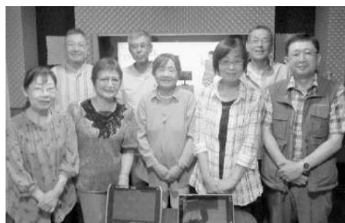
声を出して若々しく

私たちのカラオケクラブは現在、北鯨城会会員15名、会友員15名の30名の方が活動されています。その内訳は男性12名、女性18名となっています。