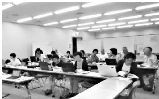
自習でわからないところを復習

北鯨城だよりをお借りしてパソコンクラブの現況をお知らせいたします。今年には24、28、32期生3名(女性)の方が入会されました。講義は 趣味発見! 「なるほど楽しいワード2013ドリル」教材は、身近な題材を通して、ワード