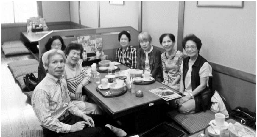
集会に男性会員も参加して欲しい??

集会はなぜか固定化された10名弱の会員（現在ウォーミングアップ中の新入会員に参加を期待）を前にブロック長が「幹事会報告」から始まるが、モーニングの方が忙しくほぼ聞いてはいない。しかしこれでよいとするのがくささやかな集会＞の姿なのだ。集会等には参加できないが「社会奉仕の理解者」もいるのも嬉しい。社会奉仕活動参加者率では自慢できるのではないだろうか＜それなりの社会奉仕への協力＞である。