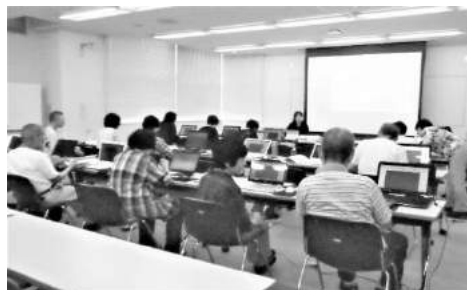
講師による講座は気合が入る

ーカーはどこにするか■サイズ・形状(液晶のサイズはモバイルノート13.5、スタンダードノート15.5、サイズに注意)安価なCPUもありますが使っているうちに遅くなることがあります。■メモリは4GBか8GBが望ましいです。■ストレージ、HDD(ハードディスクドライブ)は500GB、1TB■SSD(ソリッドステイトドライブ)は256GB以上がのぞましい※どちらもバックアップは必要。いつ壊れるかわからないので大事な資料はUSBに入れて保存して置くと良いと思います。パソコン・プリンターなどに不具合が生じた場合(修理、部品交換)は、メーカー側は次々と新しい機種を造るため、「何月何日に製造が終わって修理期間が過ぎています」と店員さんに言われ腹立たしく思い、帰ってきた事があります。(製造中止情報はスマホ、パソコンのインターネットなので調べる事ができます)。