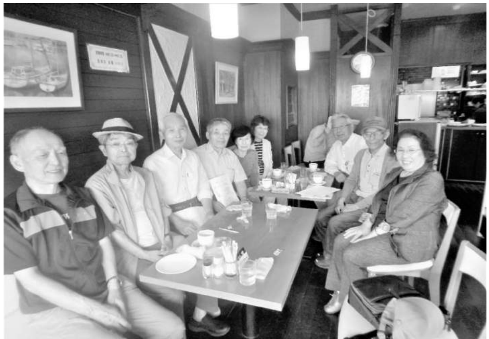
Eブロック ミニ集会「喫茶らぼ」にて

そして新入会員が少ないです。一昨年は1名、昨年は2名、そして今年はゼロです。年平均1名です。かつては、3名程はありました。他のブロックも同じような事情の様です。寂しいことです。このような状況ではありますが、各種の行事に、クラブ活動に、ボランティア活動に頑張っている会員も居られます。幹事の方