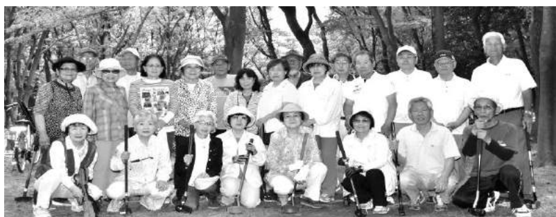
夏は名城公園の木立の中でプレーをします

火曜会は構成するメンバーに特徴があります。今年度初めの構成員34名の内訳は、北鯉城会会員が18名、他の区会鯉城会員が6名、鯉城会には加入していない一般市民の会員が10