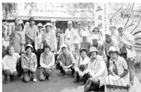
美化活動を終えて

平成30年社会奉仕活動は4月から翌年3月まで、月2回各ブロック輪番制で名城公園北園の清掃、除草と、年2回4月と11月に三つの花壇に花約2500苗を鯉城会の有志の方々と花植えをしました。この奉仕活動は「名城公園北鯉城公園特定愛護会」の名称で名古屋市の緑のまちづくり条例施行細則第26条第1項の規定で認められた会です。特定愛護会Bの認定を受け「年2回以上の除草及び月2回以上の清掃活動」が決められています。その報酬として年間84000円支給されています。これは各ブロックの皆さんの絆と、あさがお塔を管理しているガーデニング同好会の汗の結晶です。