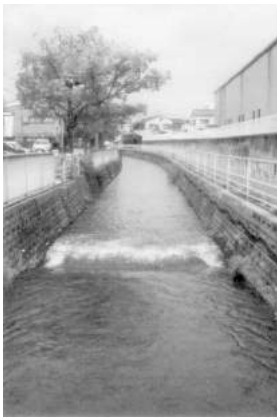
惣兵衛川が学区を分断

15期から32期までの20名内訳は男女各10名です。当学区を北と南に分断するかの様に、惣兵衛川が流れている事を知らない方が多いのではないかと