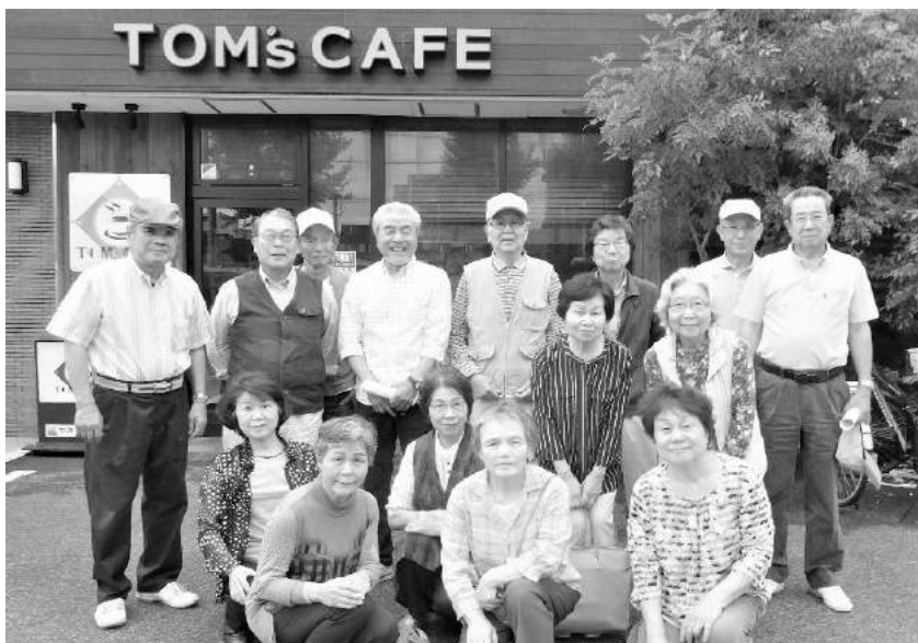
皆さんは懇親ランチ会を楽しみにしています