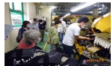
マドラス大口工場見学

そこで、9月から庄内川河川敷にある「幸心公園」で「パークゴルフ」を開始する予定です。18ホール約1時間半楽しめます。まずできることから始めていきます。