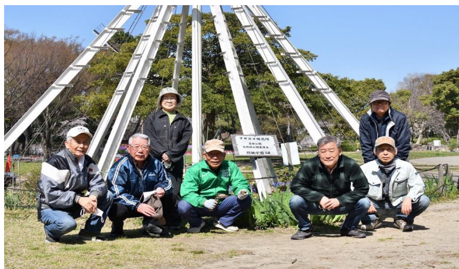
(右) 解散したガーデニングクラブの皆さん (上) あさがお塔の手入れ