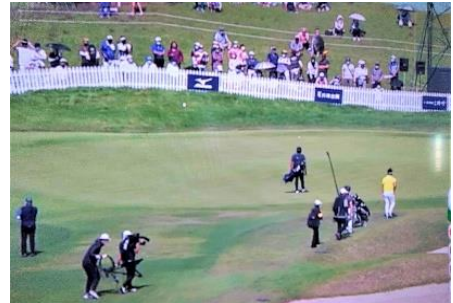
バッグ担いでライン読み

に、大きなバッグを専属のキャディーに担せ、運ばせプレーしたが彼に勝てなかった。自分の若き頃の上達を目指しながら、イライラし汗だくで担いでプレーしたころを思い出し、久しぶりに清涼感を味わったゴルフ中継だった。Bravo!