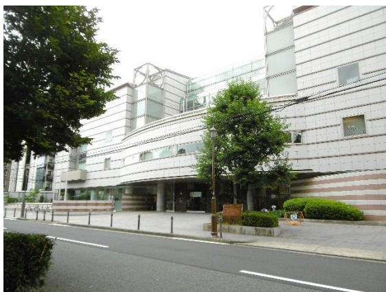
会場のウイルあいち