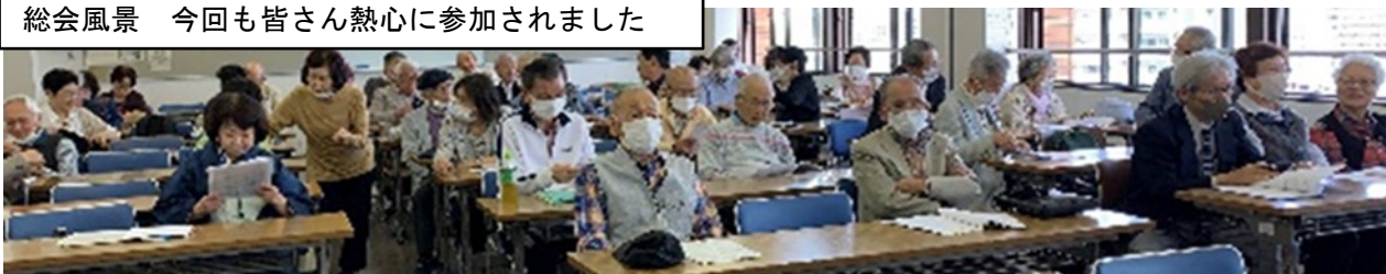
総会風景 今回も皆さん熱心に参加されました