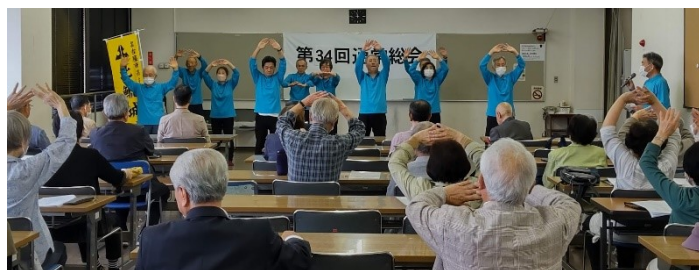
座ってもできる太極拳？さあみなさん一緒に！