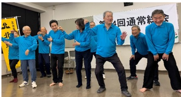
太極拳クラブ実演 みんな笑顔です