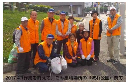
2017.4.1作業を終えて、ごみ集積場所の『流れ公園』前で

平成18年度から「街路樹特定愛護会」となり、月2回 年24回の活動を名古屋市と約束しています。ささやかながら名古屋市から報奨金が出ますので、作業を終えた後で、一杯のコーヒーを飲みながら楽しいご苦労さん会を開いています。28年度の活動実績は、24回の活動日に延べ237名の参加がありました。1回あたり10名になります。ボランティア活動は、文字通り、“ 継続が力 ”です。今後も「明るくきれいな街づくり」のために活動を継続したいと考えていますが、ご多分にもれず、この会も会員の老齢化により、活動を継続できない方も出てきております。当会の設立以来引き続いて活動されているのは、わずか3名になりました。新しい力が必要です。決して体力のいる難しい仕事ではありません。約1.2キロの散歩の心算で気軽に参加してください。