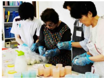
メイトウホスピタル