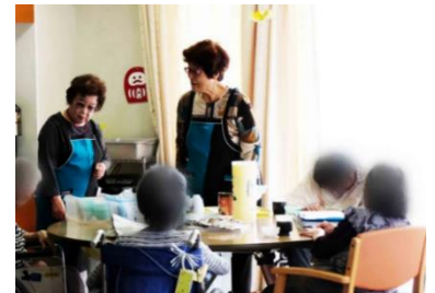
給茶サービス 名東老健