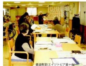
書道教室 デイサービス 平和が丘