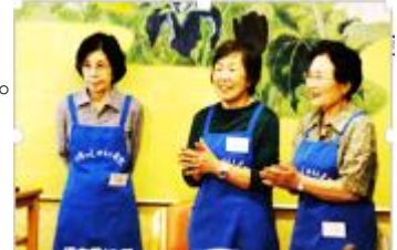
給茶サービス 極楽苑