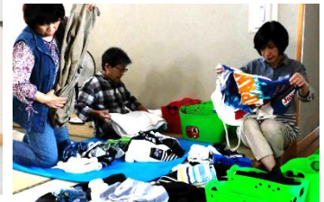
洗濯物整理 中日青葉学園