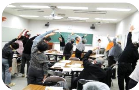
討議の前に、みんな揃って1・2・3…

名東鯨友会の活動については、現在進めている鯨友会の抜本的改革案について簡単に説明したほか、鯨友会ニュースと、4ページにまとめた会の写真集を配布して若干の説明を加えることに止め、次の班別討議に時間をとることにしました。