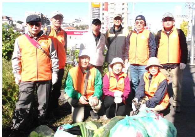
ゴミ収集を終えて、高針橋東交差点 分別作業後の写真

約1時間の清掃の後、付近の喫茶店で“モーニングサービス”。コーヒーなどを味わいながら、懇談の場を持った。話題は、12月の臨時総会を控えて、定員割れの鯉城学園、入会率の低下した鯉城会の現状について、意見や感想が出された。