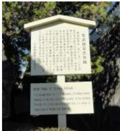
柴田勝家生誕地の案内